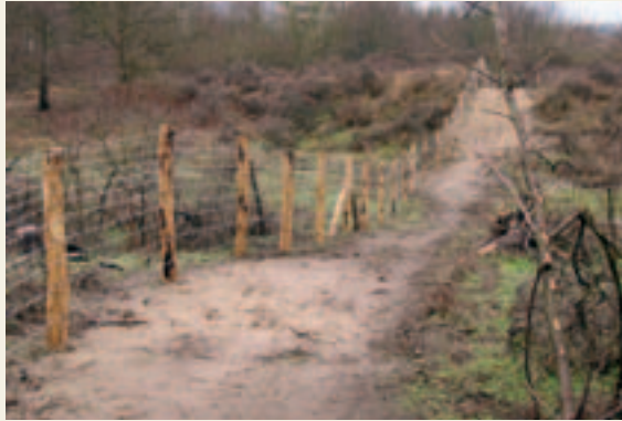
Er worden graaszones gecreëerd met afsluitingen. Poorten en hekjes blijven echter de toegankelijkheid verzekeren.

In januari begonnen de natuurinrichtingswerken in de Noordduinen. Er worden werken uitgevoerd om de natuur te versterken, de recreatie te geleiden en het landschap te bewaren. Van april tot augustus (tijdens het broedseizoen en het toeristisch seizoen) zal er niet gewerkt worden. In september hervat de aannemer dan de werkzaamheden. Als gevolg van de werken zullen de duinen er de eerstvolgende maanden nogal kaal en ruig bijliggen. Maar dat is tijdelijk. Volgend jaar zal de natuur zich al voor een groot deel hersteld hebben en over enkele jaren zullen de Noordduinen weer een écht duingebied zijn, met afwisselend open zandvlaktes, mosduinen, duingraslanden en struikgewas.