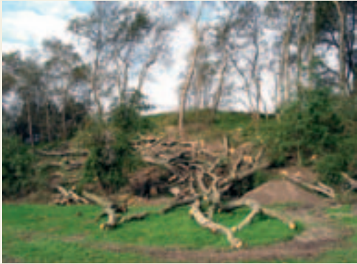
Populieren en esdoorns horen niet thuis in de duinen. Daarom worden ze bijna allemaal verwijderd.