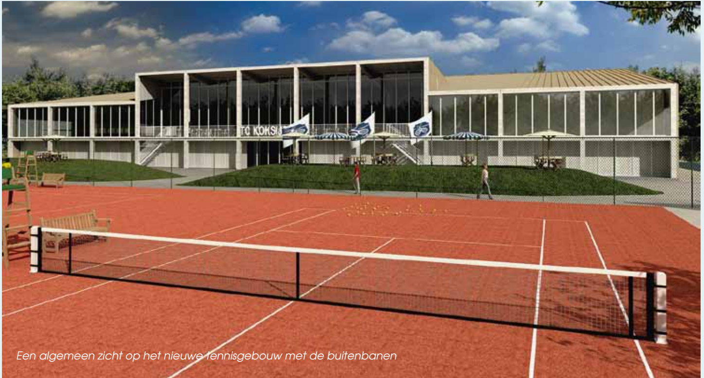
Een algemeen zicht op het nieuwe tennisgebouw met de buitenbanen

Om de bloeiende tennissport in Koksijde nog meer kansen te geven investeert het gemeentebestuur ook in een nieuwe tennisaccommodatie. Aldus zal in de nabije toekomst op het sportdomein in Koksijde-dorp een nieuw tenniscomplex verrijzen.