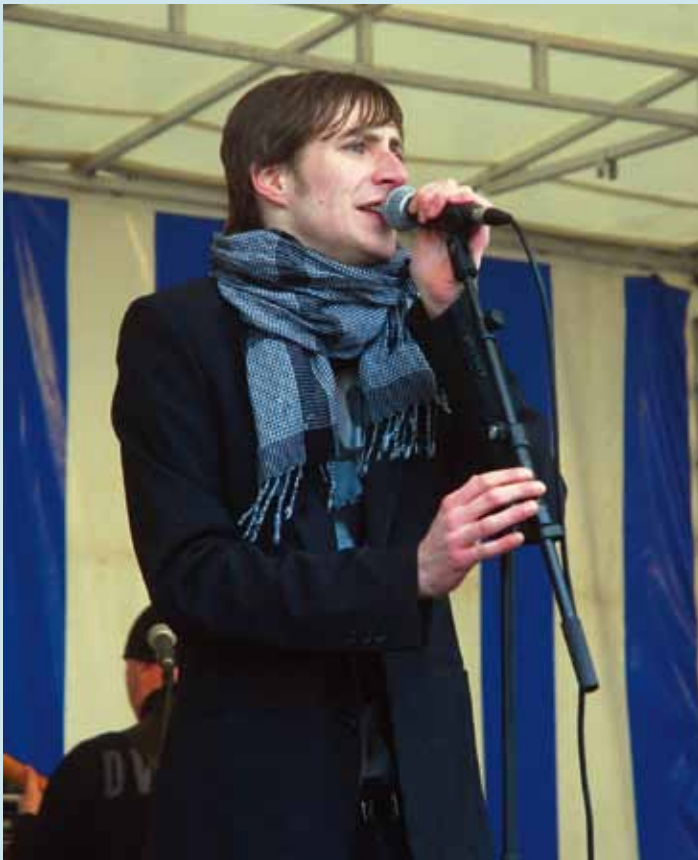
Ter afsluit van de David-fietsdag bracht de groep Fosco nog een gesmaakt optreden op het Theaterplein bij het gemeentehuis.