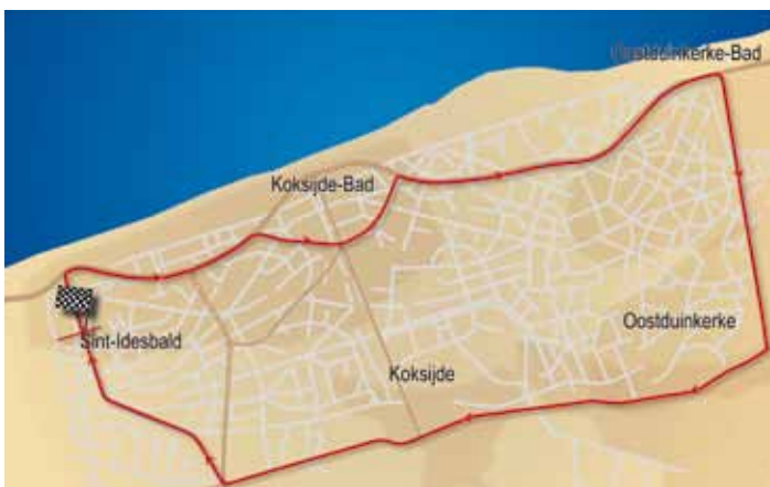
Lokaal parcours voor woensdag 31 maart, 2de rit Zottegem-Sint-Idesbald

* Verkeersverbod - De Strandlaan, tussen het kruispunt Willem Elsschotlaan en het kruispunt met de Koninklijke Baan wordt tussen 8 en 11 u., en tussen 13.30 en 17.30 u. afgesloten voor alle doorgaand verkeer. De nodige omleidingen zijn aangeduid.