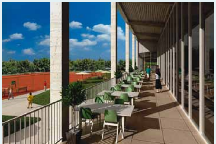
Het complex omvat ook een gezellig buitenterras.