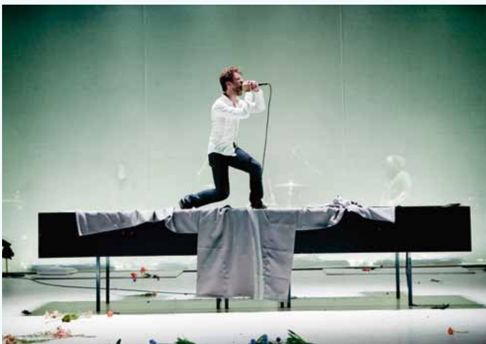
Nu niet meteen thuis proberen...

c.c.CasinoKoksijde, Casinoplein 10-11, T 058 53 29 99, F 058 53 29 97, cc.casino@koksijde.be