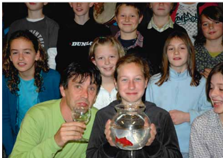
Goudvis Blinkertje kon het werk beslist appreciëren.

De derde graad bezocht in de Ardennen de stuwdam van Nisramont en ondervond dat drinkbaar water maken en verdelen een échte industrie is. Het lukte de leerlingen met veel geduld om een troebele kom water helder te krijgen. Er kwamen propfen watten, keitjes, zand, filterpapier en houtskool bij te pas. De goudvis Blinkertje kon het werk beslist appreciëren.