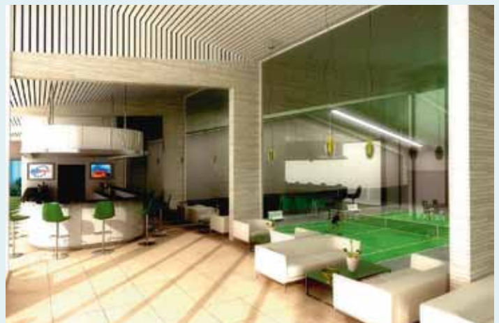
Een beeld van de cafeteria met rechts de binnenbanen die in de kunststof plexipave aangelegd worden.

De kostprijs wordt geraamd op 2,5 miljoen euro (BTW incl., erelonen excl.). Ontwerper is de tijdelijke vereniging Alain Bossuyt Ingenieur-Architect - Van de Walle-Bossuyt architecten bvba uit Roeselare.