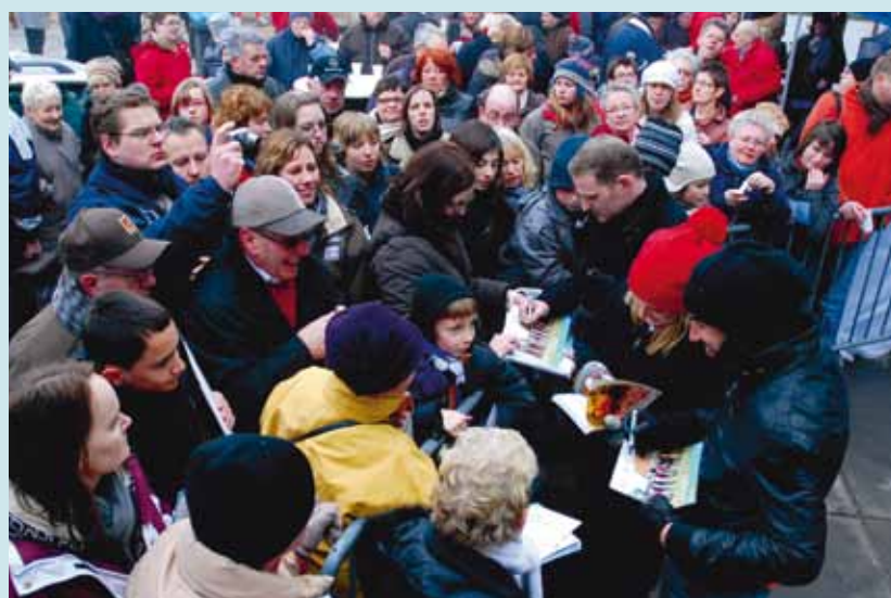
Een enthousiaste massa op het Theaterplein!