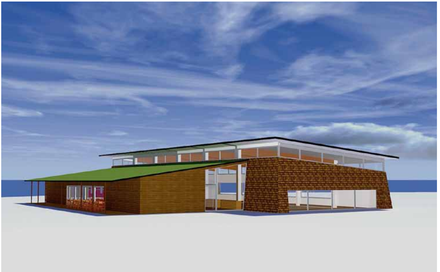
Een beeld van de toekomstige accommodatie voor petanque- en duivensport achter de sporthal van Oostduinkerke.