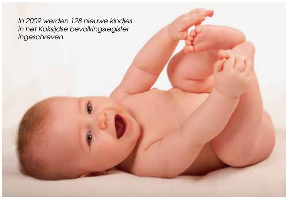
In 2009 werden 128 nieuwe kindjes in het Koksijdse bevolkingsregister ingeschreven.

Totaal: 21.832 personen (10.713 mannen en 11.119 vrouwen)