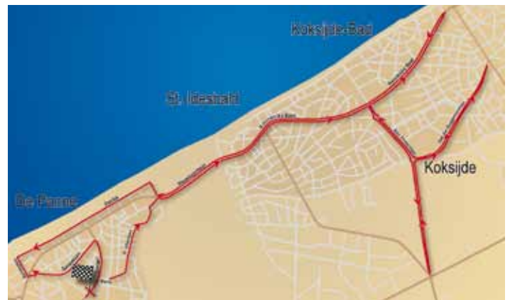
Lokaal parcours voor donderdag 1 april, rit 3b, individuele tijdrit in De Panne en Koksijde

* Verkeersverbod - Deze straten worden ook voor alle verkeer afgesloten tussen 13.30 en 17.30 u.