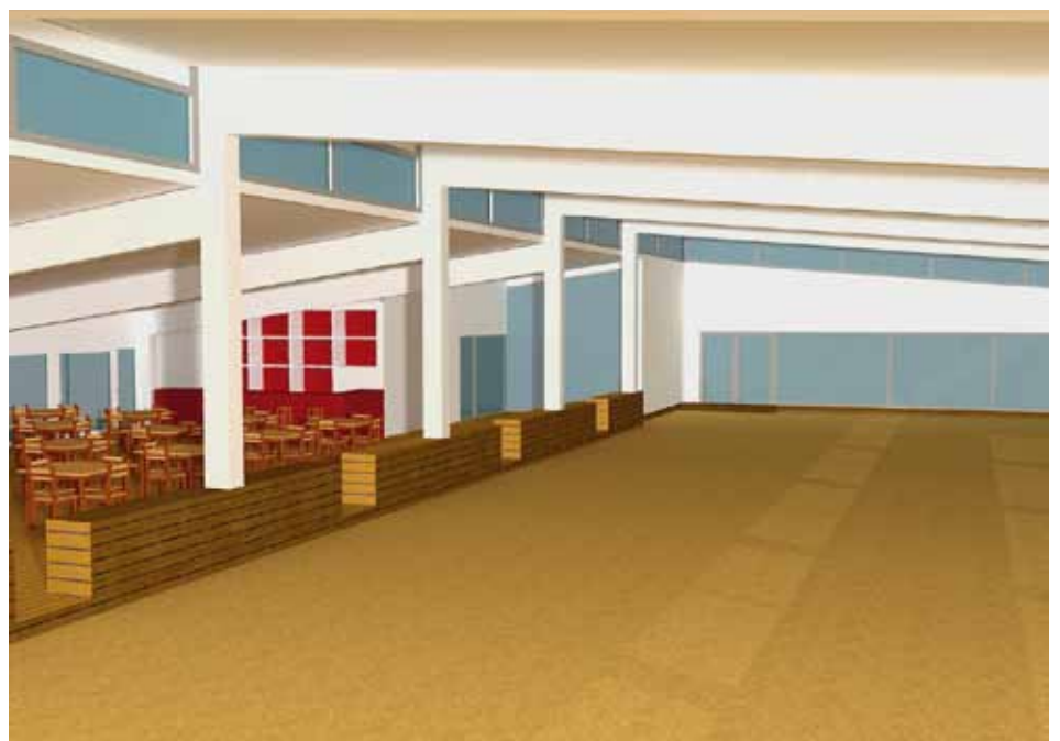
Op dit binnenzicht ziet u de overdekte banen en links een deel van de cafetaria.

Gezamenlijk zijn sanitaire voorzieningen, bar, cafetaria en berging. De kostprijs van deze investering bedraagt 1.121.291 euro, BTW in. Ontwerper is het studiebureau Plantec uit Oostende. De bouwtermijn bedraagt 160 werkdagen. De voltooiing wordt tegen half augustus verwacht.