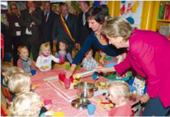
Appelmoes proeven in de peuterklas.