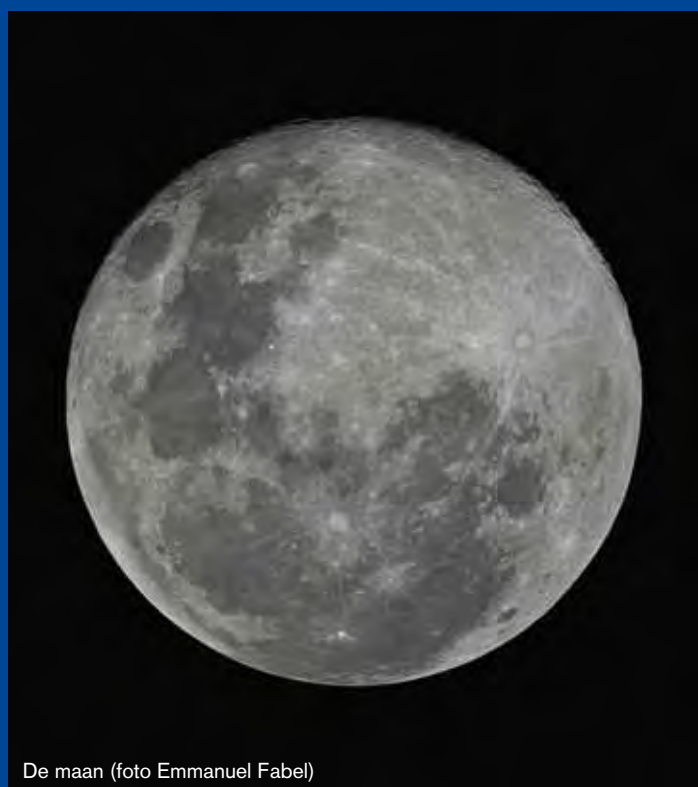
De maan

Het Duinenhuis in 't Schipgat organiseerde een nachtwandeling door de duinen, waarvoor 35 deelnemers opdaagden. Er werd geluisterd naar het ruisen van de zee, de stilte van de nacht en de verhalen van de natuurgidsen en sterrenkenners. Op het dak van het Duinenhuis was een fenomenaal en bedwelmend nachtelijk zicht op de zee werkelijk de kers op de taart!