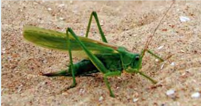
De grote groene sabesprinkhaan, zeer zeldzaam maar wel aanwezig in onze duinen!

Op het vlak van milieu is/was het jaar 2010 het Jaar van de Biodiversiteit. Ons gemeentebestuur en Natuurpunt Westkust bekroonden dit bijzonder jaarthema in de Duinenabdij op zaterdag 20 november (jaarlijkse Dag van de Natuur) met de officiële ondertekening van het biodiversiteitscharter.