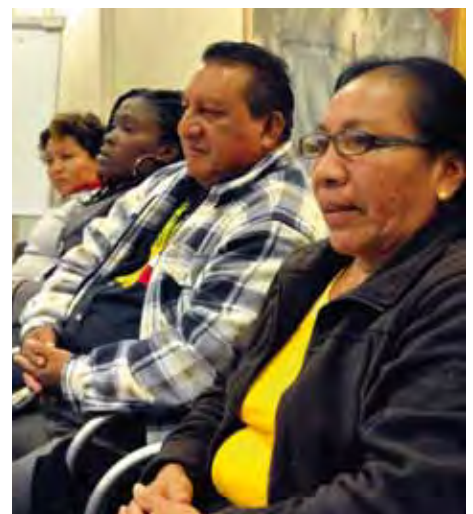
De aandachtige toehoorders uit Galibi/Albino tijdens een werkvergadering in het gemeentehuis.

In diverse andere vergaderingen werd ook de reis naar Suriname in maart 2011 voorbereid. Dan trekt een groep Koksijdenaars voor ongeveer een week naar Suriname voor een inleefreis en werkbezoeken.