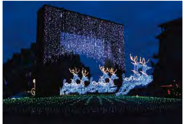
Een van de meesterwerken van de Koksijdse kerstverlichting is het prachtige ensemble van de kerstman in een door rendieren getrokken sledekoets.