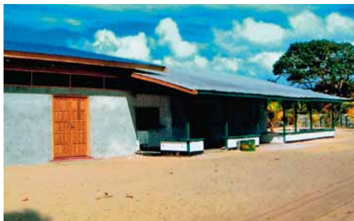
Het vrouwen- en bezoekerscentrum in Galibi is een van de projecten van de Koksijde vzw Marowijne.

Een eerste eigen project, de uitbreiding van het vrouwen- en bezoekerscentrum, is ondertussen letterlijk goed gefundeerd. Na de eerste steenlegging in november 2009 staat nu reeds een groot deel van de geplande uitbreiding in de afwerkingfase. Dit bouwproject zal enerzijds voldoende ruimte scheppen om de unieke 'arts and crafts' gemaakt door de vrouwen van Galibi te produceren en te verkopen aan ecotoeristen. Anderzijds wil het project ook voorzien in een ruimte waar degelijke info kan versterkt worden over de zeeschildpadden, de indianencultuur, het mangrovewoud,... De indianen van Galibi zijn immers ook de behoeders van de reuzenschildpadden die op hun strand eieren komen leggen en uitbroeden. Een onderdeel van het werelderfgoed!