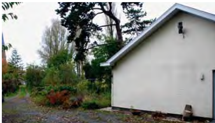
De gemeente koopt het huis Kerkstraat 35 om een wooninbreidingsproject mogelijk te maken.

Het gebruik van pesticiden, voor het vrijhouden van alle straten, voetpaden, pleinen