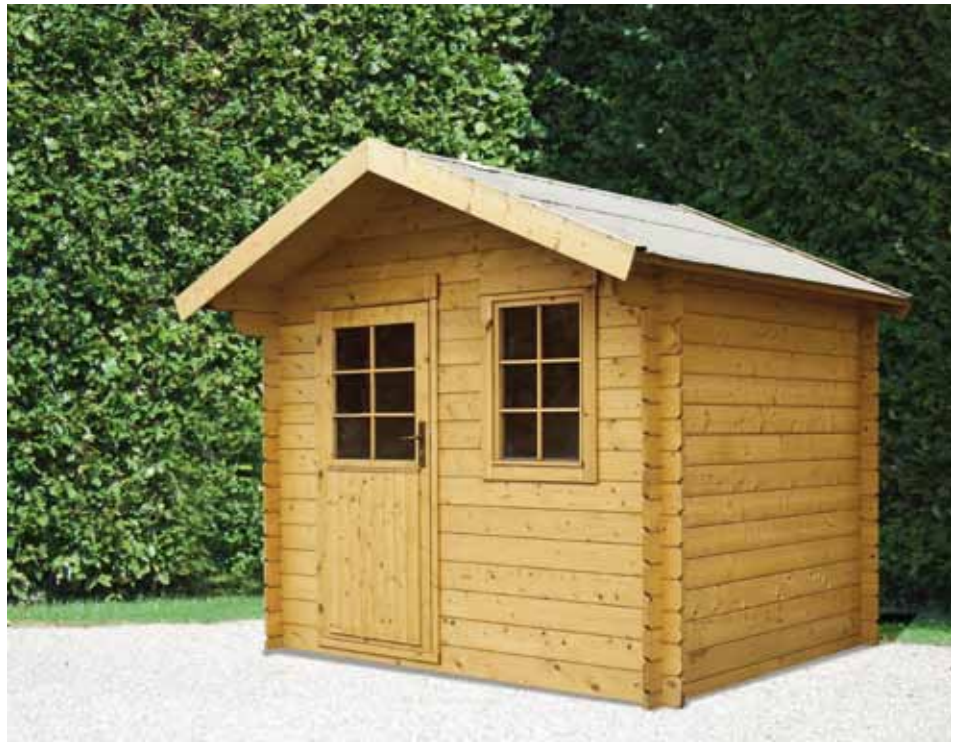
Voor een vrijstaand tuinhuisje van 40 m 2 is in de meeste gevallen geen stedenbouwkundige vergunning meer nodig. Toch blijft het belangrijk u goed te informeren bij de dienst Stedenbouw!

Met de meldingsplicht gaat ook een zekere procedure gepaard. Het volstaat dus niet om telefonisch, per mail of per brief mee te delen dat u bepaalde werken zal