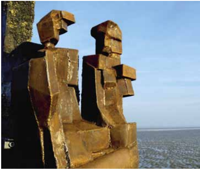
Een kunstwerk van beeldhouwster Jenny Reynaert in de eerste editie van Getij-Dingen (2009).

Wie tijdens de zomer van 2009 op ons strand vertoefde moet ongetwijfeld tussen hoog en laag tij een kunstwerk hebben ontmoet, een of ander beeld of uitgewerkt concept, bevestigd aan een stevige meetpaal ergens op een zandbank of in het midden van een diepe plas. Dit kunstwerk maakte deel uit van het project Getij-Dingen dat heel 2009 de stranden van Oostduinkerke, Koksijde en Sint-Idesbald sierde. In 2012 volgt een tweede editie van Getij-Dingen.