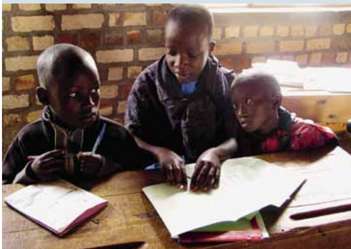
De opbrengst van het kaasbuffet gaat naar blinde jongeren in Rwanda en kansarme jongeren in Vlaanderen.

Info: lidsecr@scarlet.be, T 0476 85 79 48