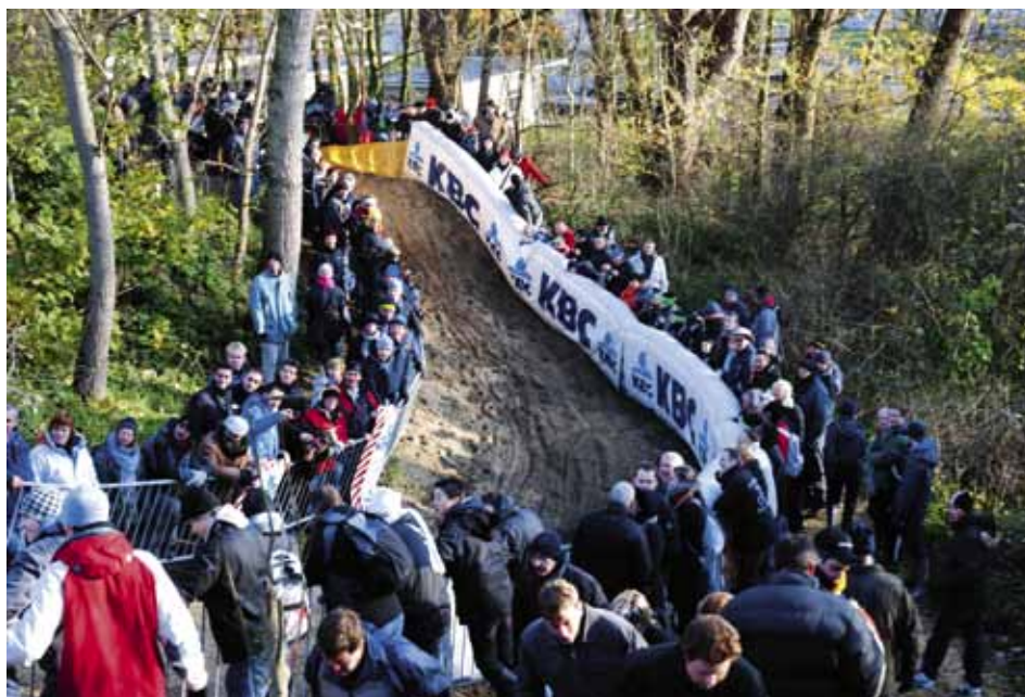
Het nieuwe parcours, zowel door renners, pers en supporters goed onthaald, slingert zich als een salamander door de bosrijke Koksijdse duinen.