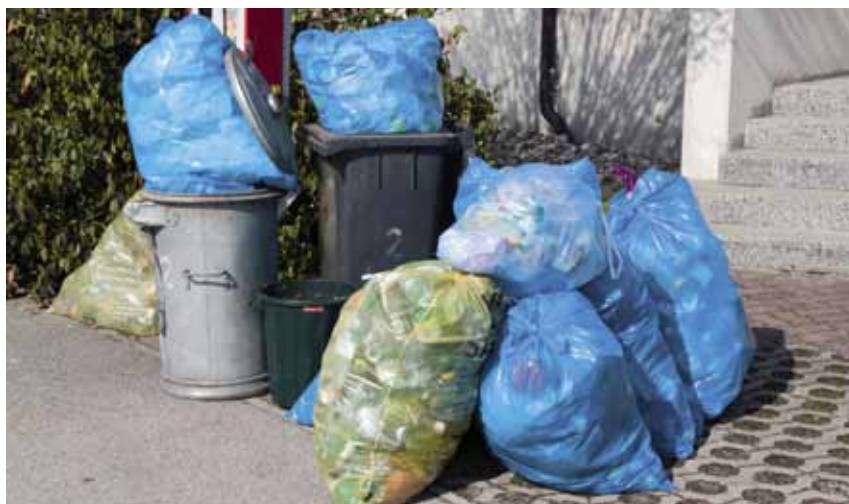
Vanaf januari 2011 gaan de GAS-vaststellers de baan op. Overtreders van gemeentelijke administratieve reglementen riskeren een boete.

Het bestuur zal bepaalde doelgroepen (maneges, immobiliënkantoren, aannemers...) aanschrijven of wijzen op de bepalingen van het reglement. Het argument (verweer) niet op de hoogte te zijn van de bepalingen, zal dan niet meer opgeworpen kunnen worden.