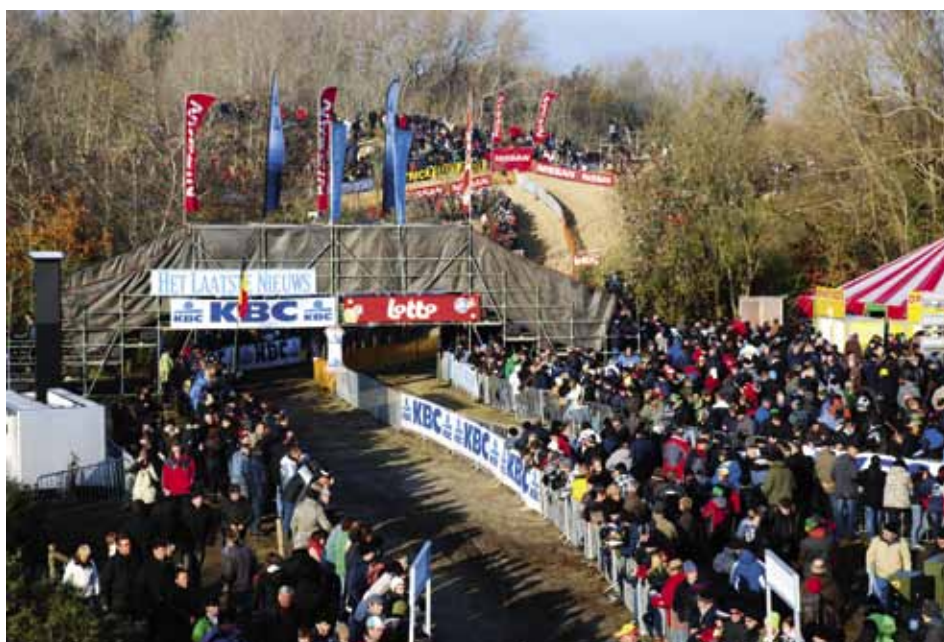
Een algemeen zicht op een van de strategische plaatsen van de duinenencross: gedroomd parcours voor het wereldkampioenschap op 29 januari 2012 in onze gemeente!