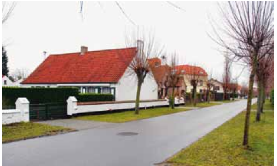
Het GRUP Strandlaan wil het kleinschalig karakter van de villawijken bewaren.

Het ontwerp-BPA Strandlaan, daterend uit de jaren '90, werd omgevormd naar een ruimtelijk uitvoeringsplan. De basis van het BPA is grotendeels behouden, enkel werd het plan geupdated naar de toestand op vandaag en vertrekt het GRUP vanuit het gemeentelijk ruimtelijk structuurplan van 2001. Dit GRUP wil het kleinschalig karakter van de villawijken, die achter de invalswegen zijn gelegen, vrijwaren. In deze zones zijn meergezinswoningen niet toegestaan. Daarnaast wordt ook het bouwkundig erfgoed in de kijker geplaatst en wordt gestreefd naar het behoud ervan. De vastgoedontwikkelingen en centrumfuncties worden geconcentreerd langs de Strandlaan en Koninklijke Baan.