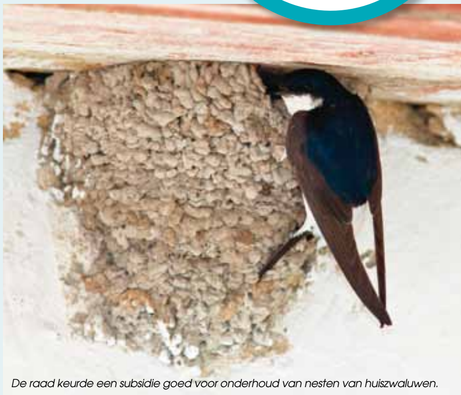
De raad keurde een subsidie goed voor onderhoud van nesten van huiszwaluwen.

Waterlopen - Onder leiding van de Polder Noordwatering worden ook in 2011 zoals elk jaar onderhoudswerken uitgevoerd aan onbevaarbare waterlopen 3de categorie en weggrachten op het grondgebied Koksijde. Inbegrepen is ook het ruimen, maaien en verbrijzelen van de maaispecie op de oever. Raming 44.609,80 euro.