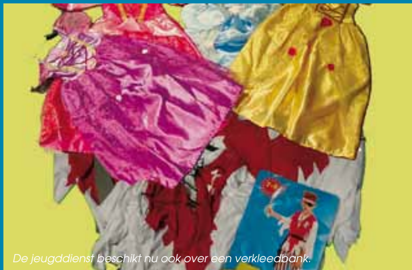
De jeugddienst beschikt nu ook over een verkleedbank.