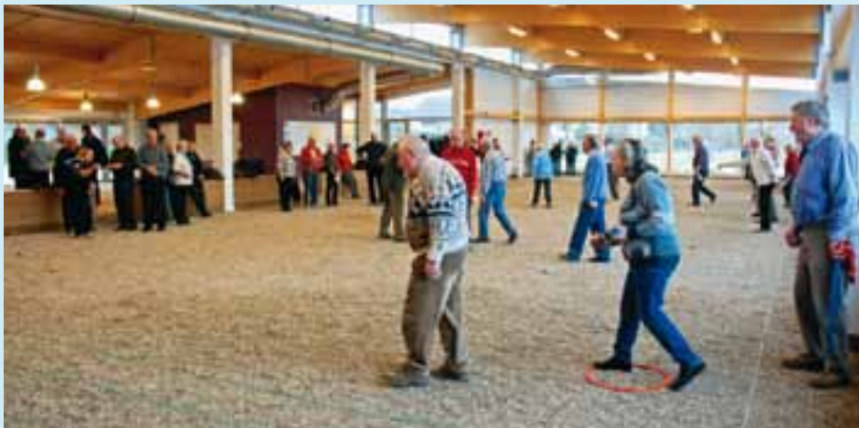
Een indrukwekkend beeld van de nieuwe petanquehal op het sportdomein Hazebeek in Oostduinkerke!

Weet u waar het woord "petanque" vandaan komt? Het verwijst naar een bepaalde manier van spelen, nl. met de voeten mooi naast elkaar geplaatst binnen een gemarkeerde cirkel. In het Provençaals (Provence, Zuidoost-Frankrijk) noemt men dit "les pieds tanqués" Vandaar de samenvoeging petanque... Onthouden voor een quiz!