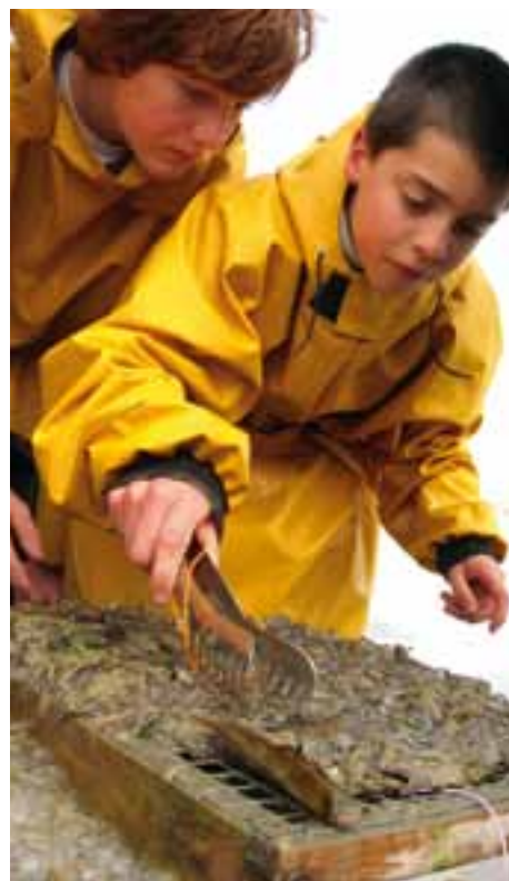
Tijdens de expeditie gaan de tieners ook na wat er allemaal in de korre van de paardenvisser zit...

Meer info: dienst Milieu en Duurzame Ontwikkeling (T 058 53 30 97), of vzw De Boot (0486 49 45 73)