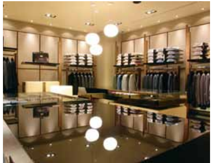
Het project Commerciële Innovatie wil de handelaars van Koksijde professionele hulp bieden bij het zoeken naar vernieuwing van de zaak, bedrijf, enz.

Daarnaast zijn er de individuele trajecten die ook uit vier stappen bestaan. De tweede stap in de individuele begeleiding bestaat uit een brainstormsessie, waarbij elke handelszaak met een 6-tal personen ideeën gaat genereren.