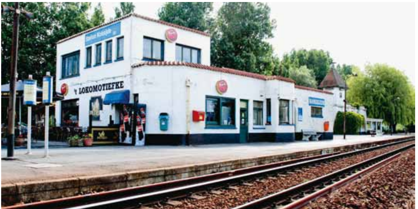
Het station Koksijde wordt vanaf 1 maart afgebroken en volledig nieuw gebouwd. Over tien maanden zal er een nieuw staan!

Tegelijk met de afbraak start aannemer Vandembroucke uit Wulpen de heraanleg van het perron en de nieuwe omgeving. Er komt een plein waar alle vervoersmodi op aansluiten. Het plein wordt een knooppunt, één groot perron, waar overstappen van bus, trein, auto, taxi... vlot en naadloos moet kunnen verlopen. Uiteraard wordt ook de parking volledig vernieuwd. Op vraag van stad Veurne blijft het deel parking achter het huidig stationsgebouw voorlopig behouden. De raming van de omgevingswerken bedraagt ca. 1,3 miljoen euro. Daarvan wordt een deel betaald door Infrabel, nl. een strook van 4 m vanaf de sporen. In het kader van Interreg IV NWE Sinntropher is een subsidie van iets meer dan 275.000 euro voorzien. Ontwerpers voor het station zijn de architecten Geldhof-Decoene, voor de omgeving Studiebureau Plantec.