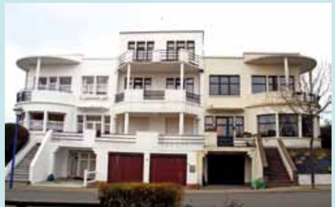
Een beeldbepalend viersterrengebouw in de Vlaanderenstraat.

Aanleiding voor de aanvulling was het recent vaststellen door de Vlaamse regering van de inventaris van het bouwkundig erfgoed die in 2009 werd opgemaakt door het VIOE (Vlaams Instituut voor Onroerend Erfgoed). Door adreswijzigingen of sloop kan het zijn dat relicten onvindbaar zijn of gewoonweg verdwenen. Het VIOE heeft daarom de adressen en de status (gesloopt/bewaard) van de relicten gecontroleerd en waar nodig geactualiseerd.