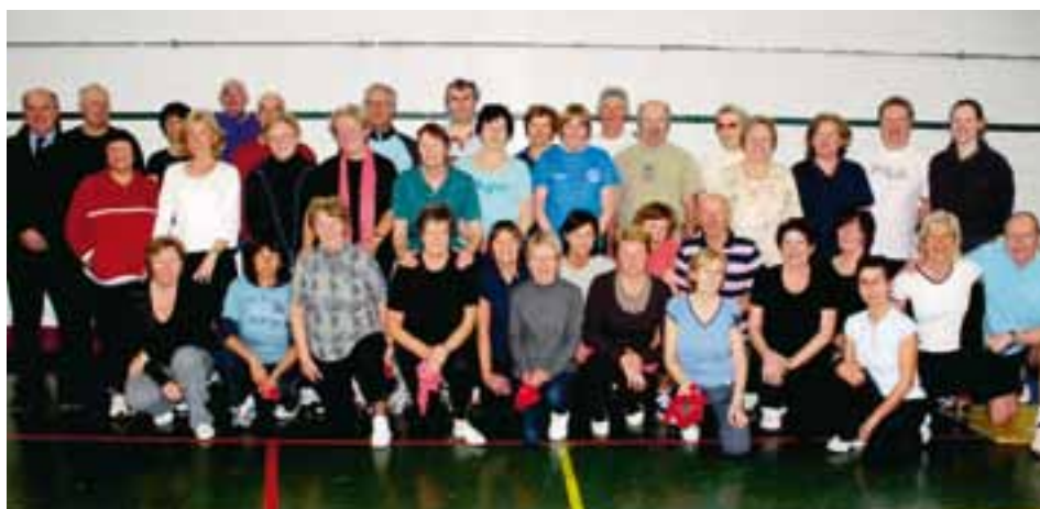
De grote groep deelnemers aan Sport Overdag!

Het programma Sport overdag in de sporthal van Koksijde-Dorp loopt nog tot en met 27 mei. Elke vrijdag (niet tijdens de schoolvakanties) kunnen dames en heren zich sportief uitleven tijdens de lessen conditiegymnastiek (10.30-11.30 u.), tennis (13.45-14.45 u.), tafeltennis (13.45-15.45 u.) en badminton (14.45 - 15.45 u.). Deelnemen kost 1,50 euro per voor- of namiddag, sportmateriaal en verzekering inbegrepen.