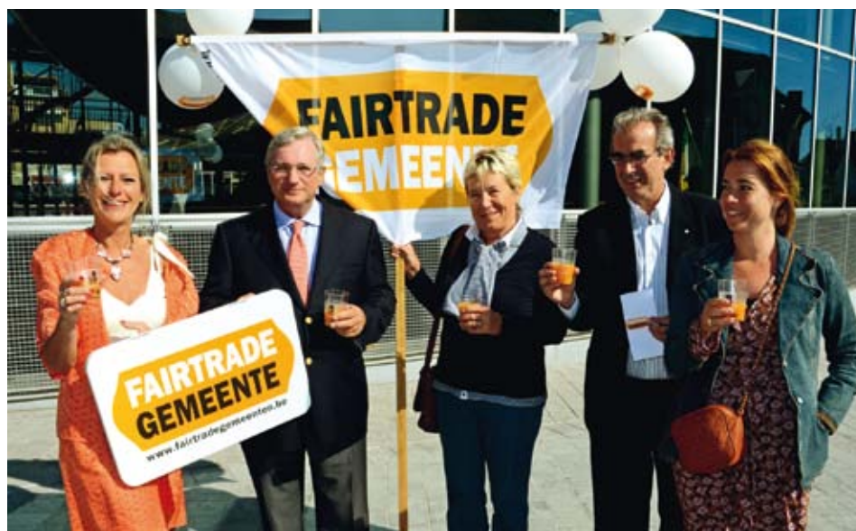
Het enthousiasme voor eerlijke handel en duurzame ontwikkeling is groot bij de officiële plaatsing van het eerste Fair Tradebord in onze gemeente. Het kreeg een belangrijke, mooie vaste plaats bij het gemeentehuis.

Ook sommige scholen doen mee: de gemeentescholen, de hotel-