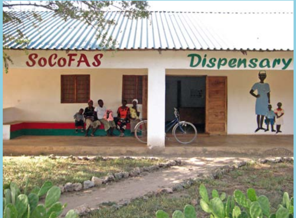
Het dispensarium in het Keniaanse dorp Maweni, waarvoor SoCoFAS ijvert en het koor Wak Maar Proper gratis zingt op 14 mei.

Annie Buysse: "We hebben daar een klein dispensarium opgericht dat nu permanent bemand is door een verpleger-vroedman, op dinsdag bijgestaan door een dokter-chirurg. Doel is de lagere schoolkinderen van Maweni gratis medische faciliteiten te bieden. Het aantal kinderen is in twee jaar tijd gestegen van 350 naar 500. Dus proberen we de sponsoring aan te zwengelen om ook die 150 bijkomende kinderen een volledig gratis pakket te kunnen bieden." Ook andere scholen in de buurt zijn geïnteresseerd, nog eens 1.000 kinderen extra. Het is evenwel niet gemakkelijk om ouders ertoe te bewegen een bijdrage te leveren voor hulp die ze misschien niet nodig zullen hebben!