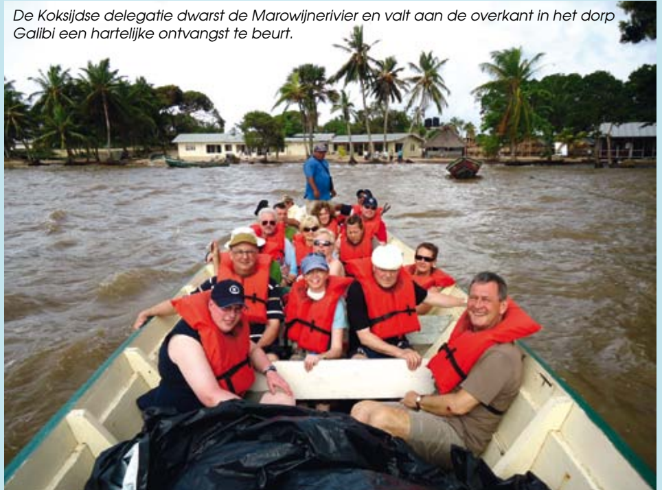
De Koksijdse delegatie dwarst de Marowijnerivier en valt aan de overkant in het dorp Galibi een hartelijke ontvangst te beurt.

duurde de hele nacht en eindigde met spirituele gezangen waarna de pater een 'westerse' teraardebestelling leidde.