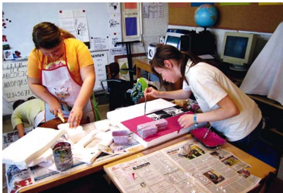
Tijdens de workshops onderzochten de leerlingen de stop motiontechniek en maakten ze een decor voor hun animatiefilm.

In de gemeentelijke basisschool werd er gewerkt rond stop motion. De leerlingen uit het zesde leerjaar maakten een eigen animatiefilm-