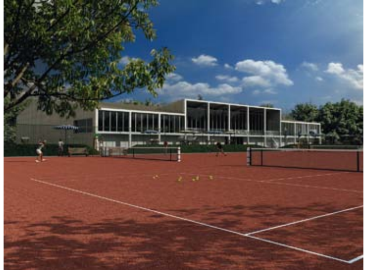
Een algemeen zicht op het nieuwe tennisgebouw met de buitenbanen

De uitvoeringstermijn bedraagt ongeveer één jaar. Daaruit volgt dat tennissend Koksijde de nieuwe accommodatie wellicht begin juli 2012 in gebruik zal kunnen nemen.