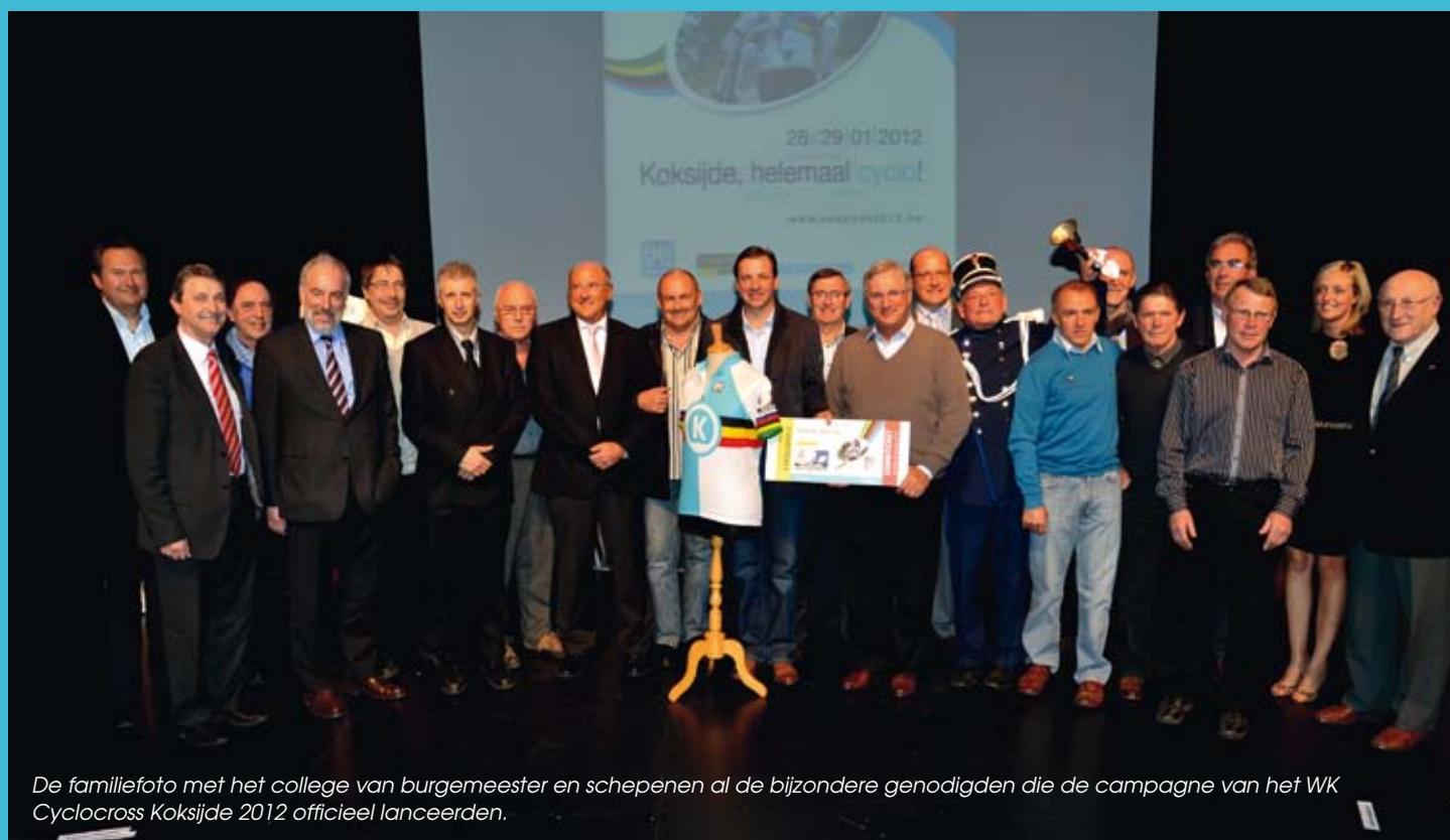
De familiefoto met het college van burgemeester en schepenen al de bijzondere genodigden die de campagne van het WK Cyclocross Koksijde 2012 officieel lanceerden.