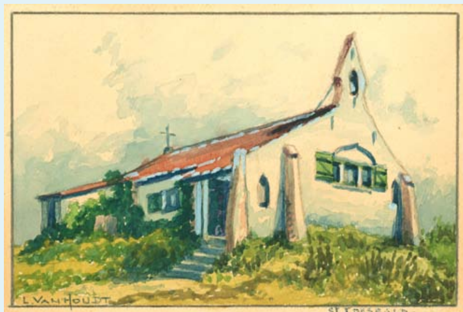
Een prachtig mini-aquarel van L. Van Houdt.

Wie ingeschreven is, wordt persoonlijk verwittigd over het binnenbrengen van de werken en ontvangt een uitnodiging voor de vernissage op dinsdag 9 augustus.