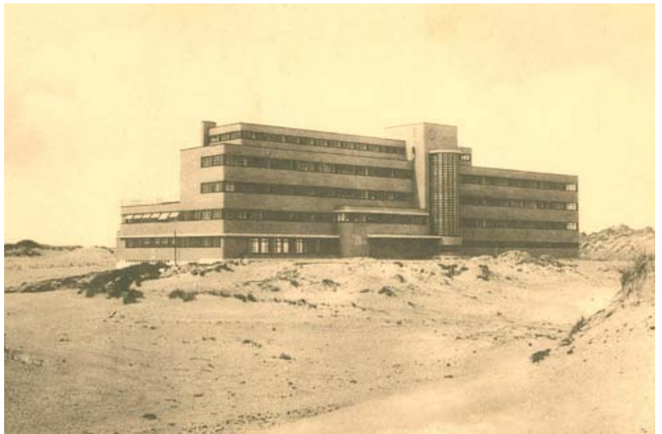
De Zeebries. Misschien herkent u dit gebouw ook als het pharmaceutisch bedrijf van de Claerhouts uit de VTM-telenouvella David

Dit beschermd monument werd in 1939 opgericht door de Fondation Louis Empain pour la Santé de l'Enfance. Het gebouw heette toen Pro Juventute - Air & Soleil . Eind de jaren '40 werd het verkocht aan een socialistische vzw die er het kinderkoloniaal De Sinjoorkens uitbaatte. Nog later werd het een vakantiecentrum voor sociaal toerisme onder de naam De Zeebries . Binnenkort start de nv Zilver Avenue met de verbouwing van De Zeebries tot een 50-tal foyerappartementen. De bewoners zullen kun-