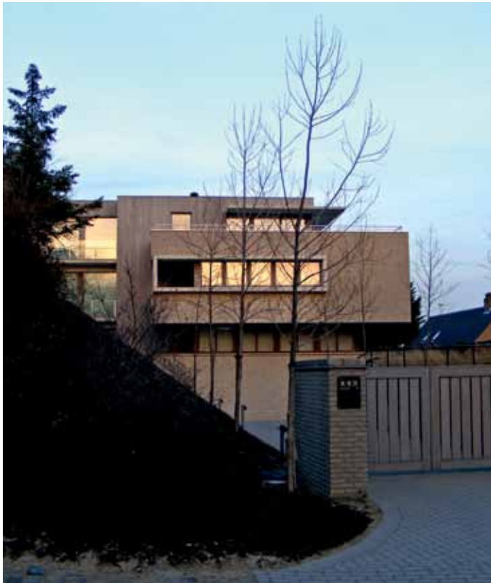
Categorie Nieuwbouw meergezinswoningen: project Herman Teirlincklaan 4