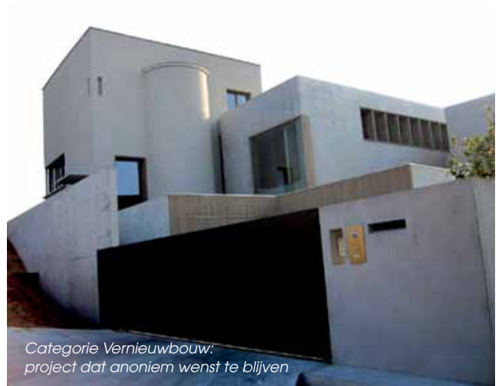
Categorie Vernieuwbouw: project dat anoniem wenst te blijven

Er werden 7 projecten ingediend, waarvan één van een bouwheer die anoniem wenst te blijven. Hij sleepte ook de prijs in de wacht. De jury motiveert zijn keuze als volgt: het was een van de enige projecten die het oorspronkelijke betrokken gebouw met een nieuwe uitbreiding kon combineren op dergelijke geïntegreerde manier zonder de identiteit van het oorspronkelijke gebouw te verliezen. De combinatie van oud en nieuw, geïntegreerd in het duinrelief werd ronduit ingenieus genoemd. Architecten zijn Coussée en Goris.