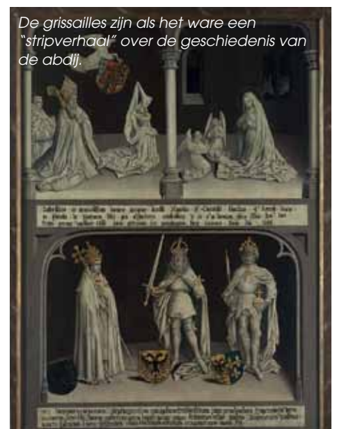
De grisailles zijn als het ware een “stripverhaal” over de geschiedenis van de abdij.

Abdijmuseum Ten Duinen 1138, Koninklijke Prinslaan 6-8, T 058 53 39 50, www.tenduin.be .