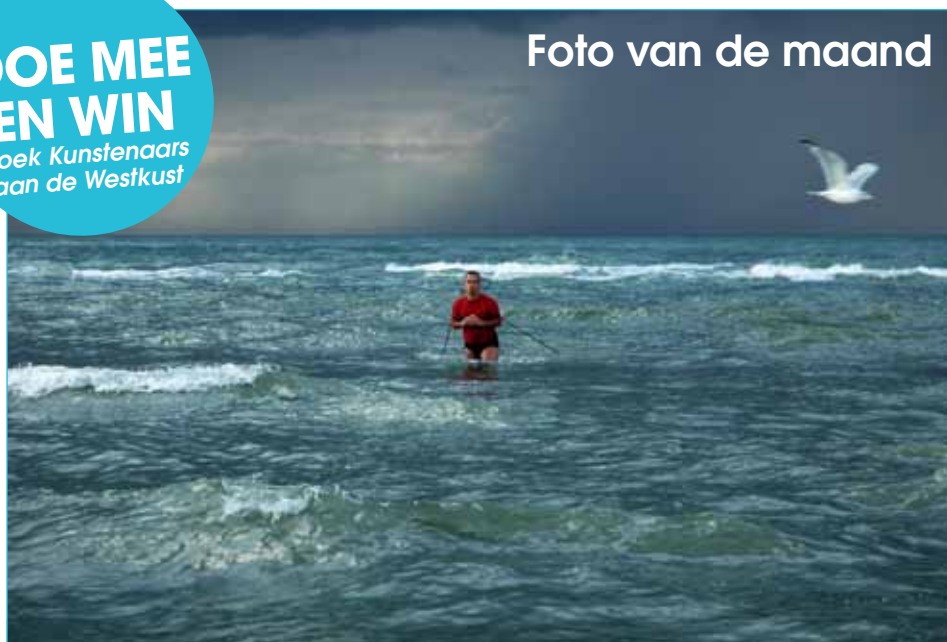
Foto van de maand