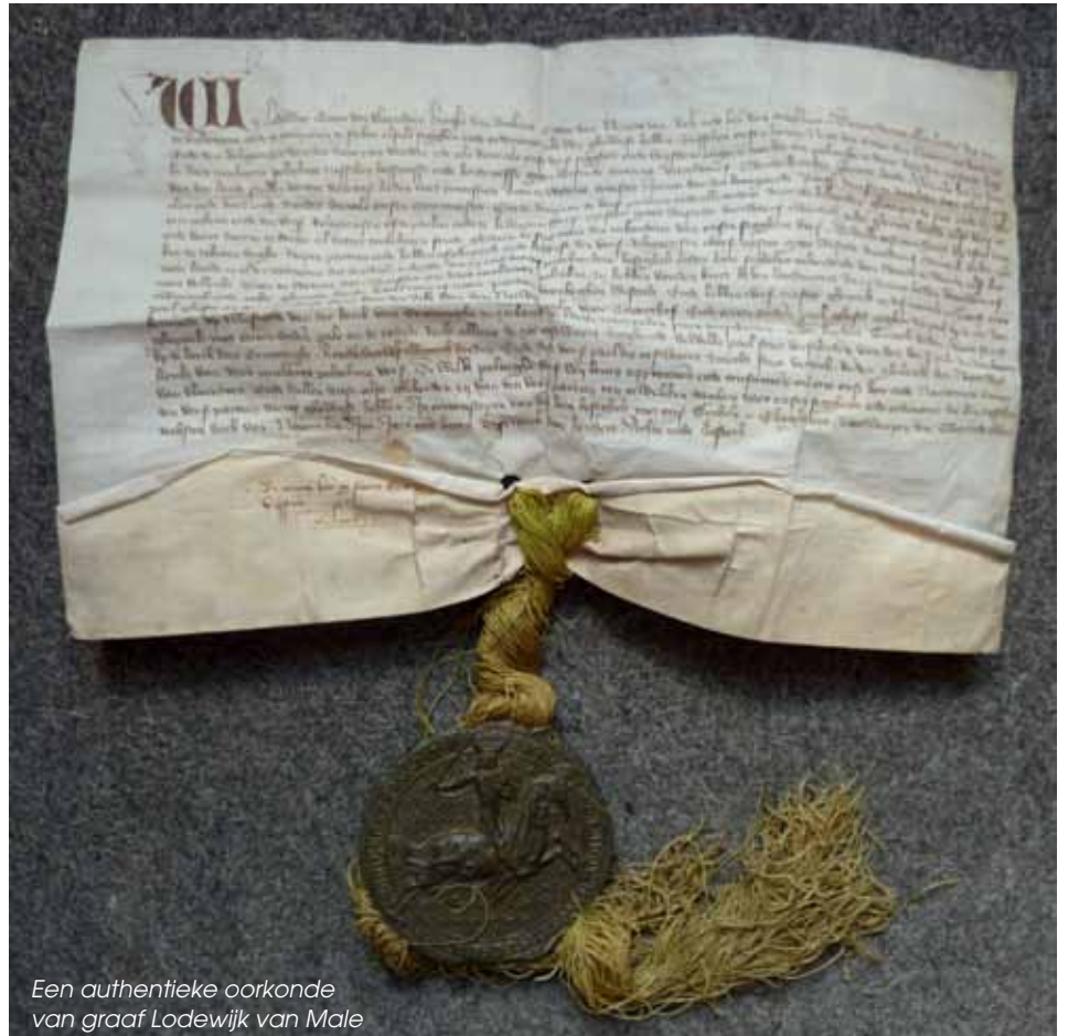
Een authentieke oorkonde van graaf Lodewijk van Male

In de tentoonstelling worden de reproducties van de grisailles aangevuld met authentieke archiefstukken, bezegelde oorkonden, juweeltjes uit vroegere opgravingen en met een mooi stuk dat recent werd opgegraven bij Hof ter Hille, een vroeger uithof van de Duinenabdij. Het resultaat is een bonte schakering van voorwerpen uit de 12de tot de 17de eeuw. Samen met de grisailles illustreren ze de veelzijdige geschiedenis van de abdij in Koksijde.