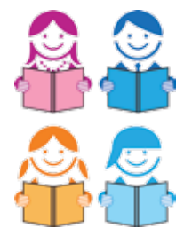
Jeugdauteur Marc De Bel leest de boekenbeurs in.

Op vrijdag 7 oktober gaat de beurs om 18.30 u. van start met een lezing door jeugdauteur Marc De Bel. De vaak bekroonde jeugdauteur Marc De Bel schrijft spannende boeken voor kinderen op de basisschool. Ze zitten vol actie, fantastische gebeurtenissen en slapstickachtige situaties. Zijn belangrijkste figuren zijn kinderen, dieren of Boeboeks (kleine groene wezentjes). De kinderen durven alles en hebben veel fantasie. Volwassenen zijn of bijzonder sympathiek of heel onsympathiek. De boeken gaan soms wel over serieuze onderwerpen als milieuvervuiling en kindermishandeling, maar door de humor worden de ernst gerelativeerd. Zijn taalgebruik is speels en lijkt op dat van kinderen, waarbij hij niet bang is om schuttingtaal te gebruiken. Sommige boeken van zijn hand werden zelfs in het Chinees vertaald en verfilmd. De beurs is open op zaterdag 8 en op zondag 9 oktober doorlopend van 10 tot 18 u. Gratis toegang.