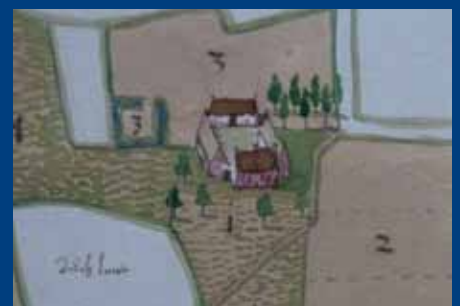
Uittreksel uit een middeleeuwse kaart. Linksonder ligt een partij "dich lant", dus eigendom van de kerkdis...

Info: Abdijmuseum Ten Duinen 1138, Koninklijke Prinslaan 6-8, T 058 53 39 50, www.tenduinen.be