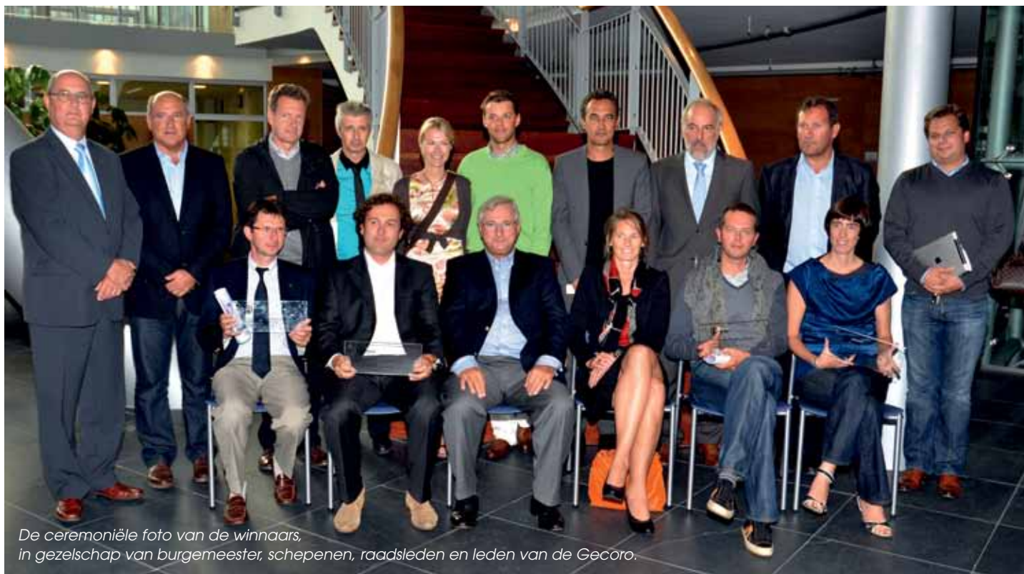
De ceremoniële foto van de winnaars, in gezelschap van burgemeester, schepenen, raadsleden en leden van de Gecoro.

De architectuurprijzen 2011 van de gemeente Koksijde werden op maandag 5 september toegekend aan de eengezinswoning Schildknaapstraat 5 in Koksijde, aan de nieuwbouw meergezinswoningen Herman Teirlincklaan 4 in Koksijde, aan een anonieme kandidaat in de categorie vernieuwbouw, en aan het project Strandlaan 268 in de categorie handel. De laureaten krijgen telkens een cheque ter waarde van 1.000 euro en een bordje om aan de gevel van het betrokken pand te hangen.