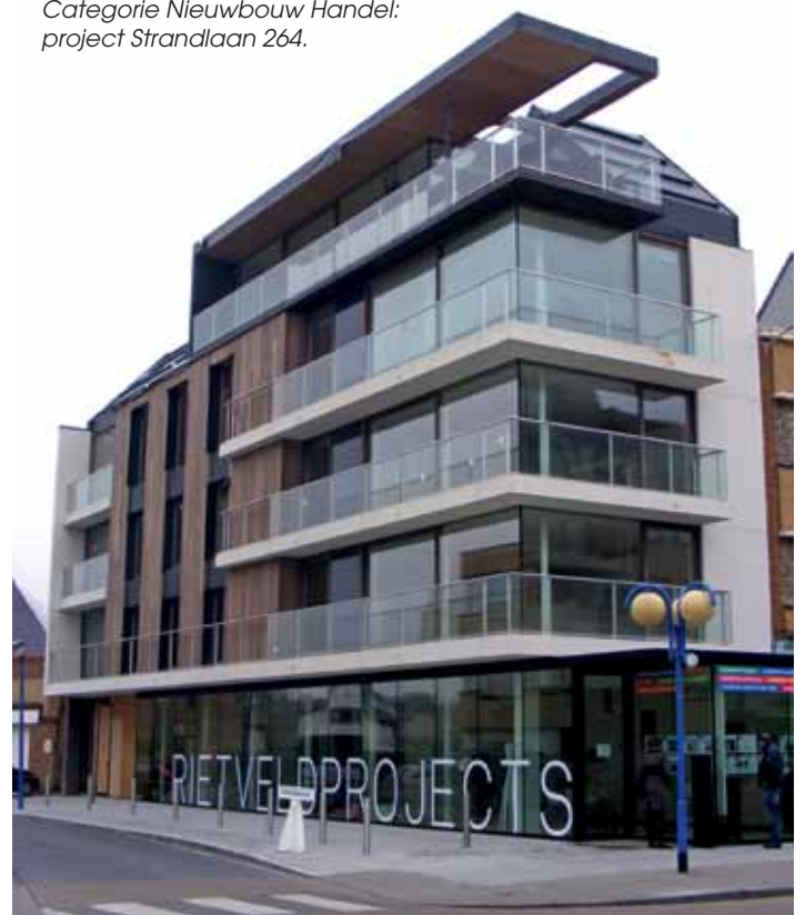
Categorie Nieuwbouw Handel: project Strandlaan 264.

In deze categorie was er maar één inschrijver: Strandlaan 264 van bouwheer Rietveld Bouwprojecten en architectenburo Govaert & Vanhoutte. De constructie is gebouwd op een hoekperceel van amper 6 m breed, maar wel 28 m diep. Dat is een moeilijke locatie. De architecten hebben er op een eenvoudige manier op ingespeeld, niet alleen op het gelijkvloers maar ook naar de bovenverdiepingen en de dakvorm toe. De handelsruimte is helder, eenvoudig en sober en kan worden beschouwd als een transparante sokkel waarop het woonvolume is geplaatst. Het hele project trekt de aandacht en betekent een meerwaarde voor de omgeving. Daarom kende de jury overtuigd ook deze prijs toe, ook al is de laureaat enige inzender in deze categorie.