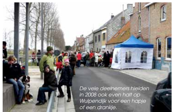
De vele deelnemers hielden in 2008 ook even halt op Wulpdijk voor een hapje of een drankje.