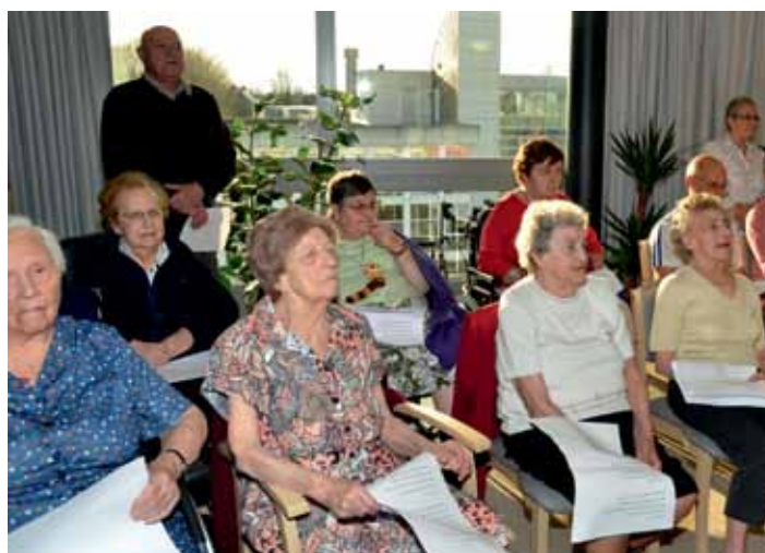
Uiteraard wordt in het rust- en verzorgingstehuis Dunecluze elke dag animatie aangeboden. Vb. samen zingen houdt de harten jong!