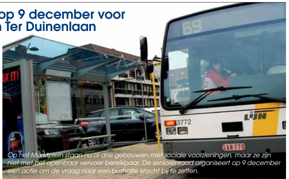
Op het Marktplaatsplein staan nu al drie gebouwen met sociale voorzieningen, maar ze zijn niet met het openbaar vervoer bereikbaar. De seniorenraad organiseert op 9 december een actie om de vraag naar een bushalte kracht bij te zetten.

De gemeentelijke seniorenadviesraad en de andersvalidenraad willen het hier niet bij laten en plannen een manifestatie om hun vraag kracht bij te zetten. Daarom