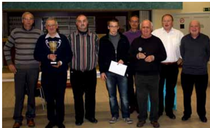
Veurne Sportief mocht de wisselbeker naar de Boetestad meenemen.