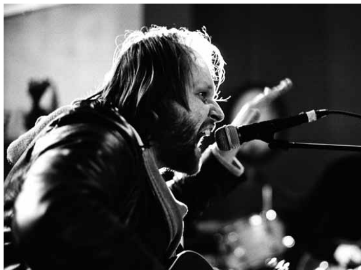
Tom Van Laere, alias Admiral Freebee speelt op vrijdag 9 december in c.c. CasinoKoksijde.

Tijdens zijn solo-tour zal de Admiraal zijn nummers vertolken zoals hij ze ooit schreef: naakt en zeer doorleefd. In het verleden kreeg hij op zijn eentje al meerdere festivalsites muistil, maar in een theateromgeving zal het lijken alsof je Admiral Freebee in zijn atelier