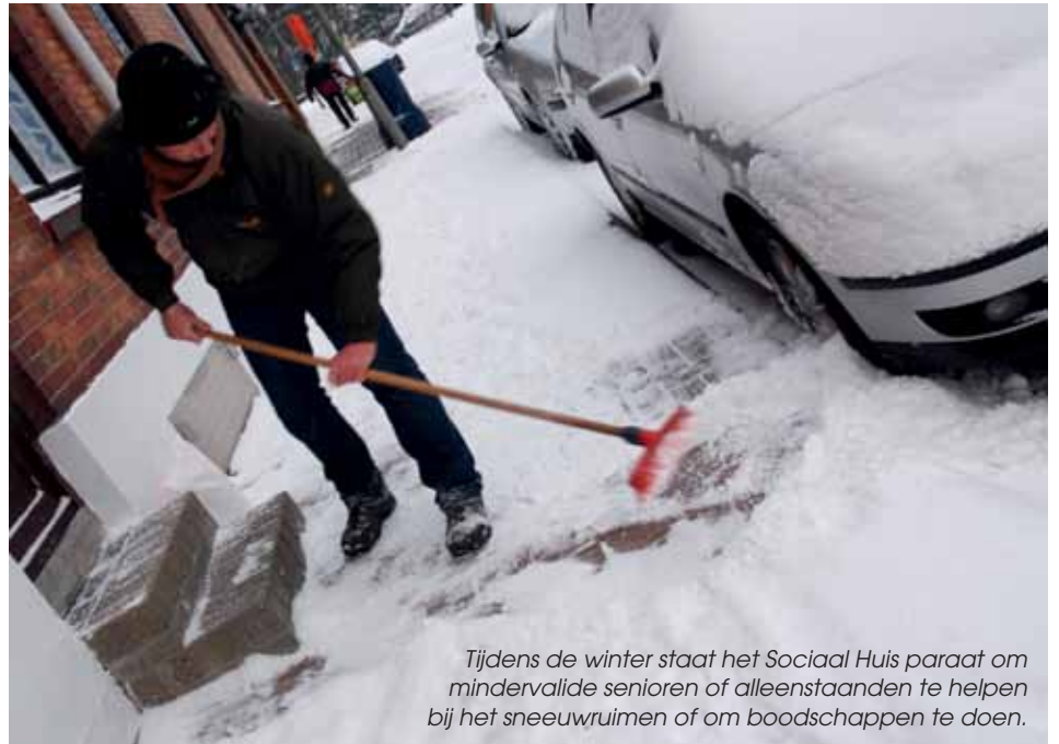
Tijdens de winter staat het Sociaal Huis paraat om mindervalide senioren of alleenstaanden te helpen bij het sneeuwruimen of om boodschappen te doen.

Kent u mensen in uw buurt die hulp nodig hebben of wenst u zich in te zetten als vrijwilliger, contacteer Natasha Dewaele, T 058 53 43 10, natasha.dewaele@sociaalhuis-koksijde.be