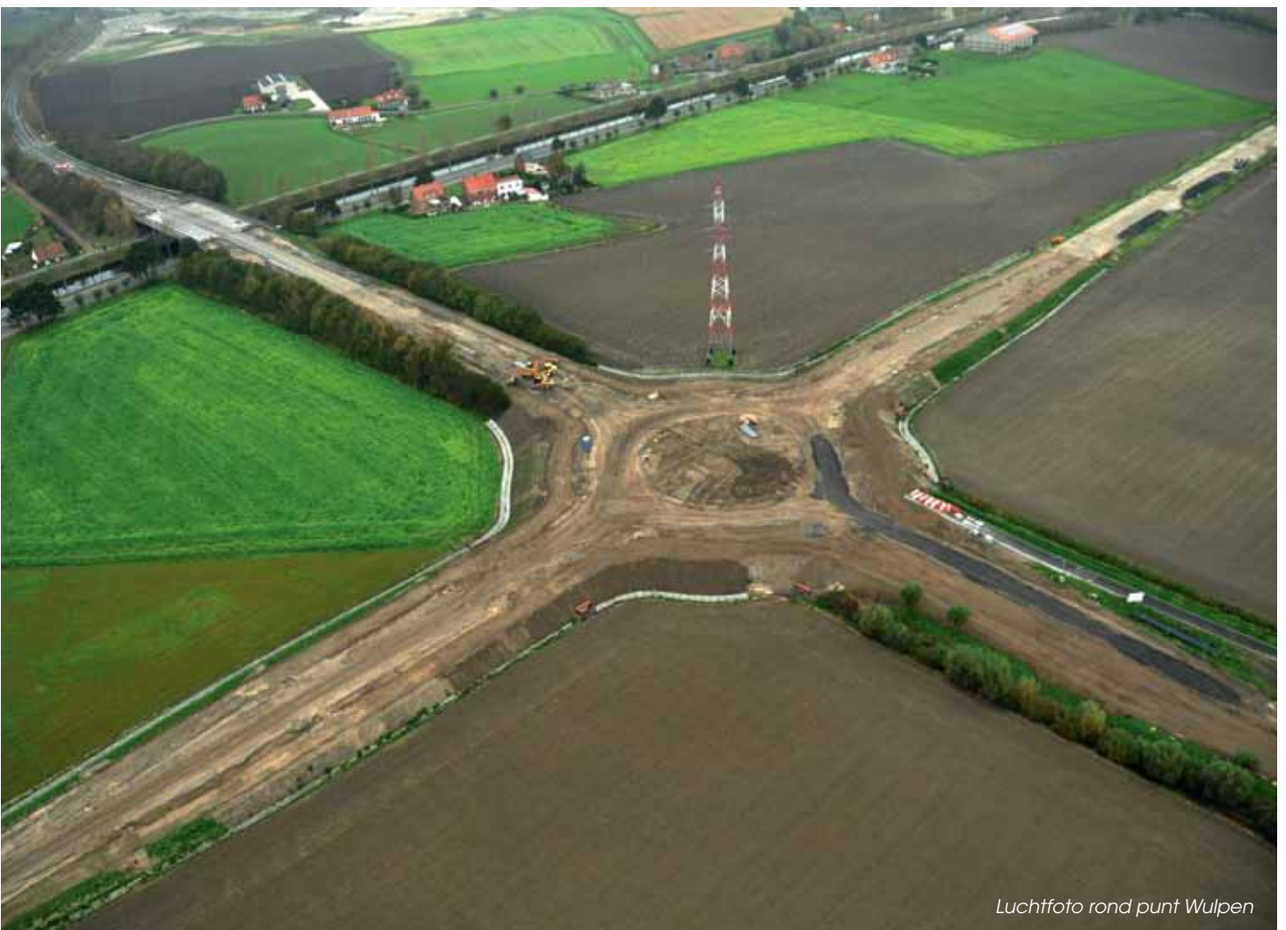
Luchtfoto rond punt Wulpen