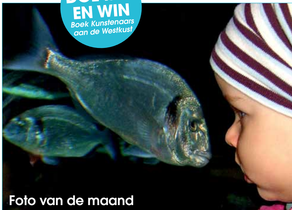
Foto van de maand