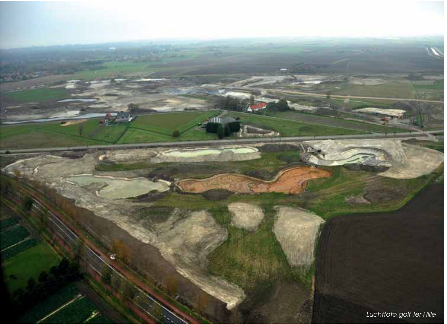
Luchtfoto golf Ter Hille