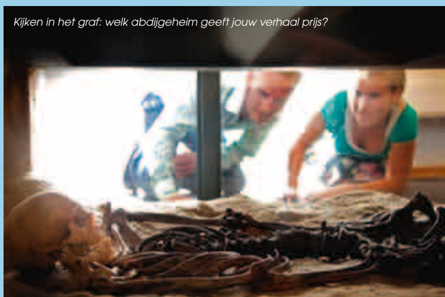
Kijken in het graf: welk abdijsgeheim geeft jouw verhaal prijs?