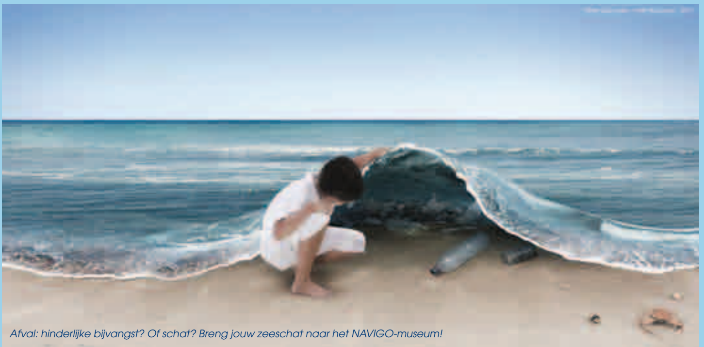
Afval: hinderlijke bijvangst? Of schat? Breng jouw zeeschat naar het NAVIGO-museum!

Info: info@navigomuseum.be of 058 51 24 68