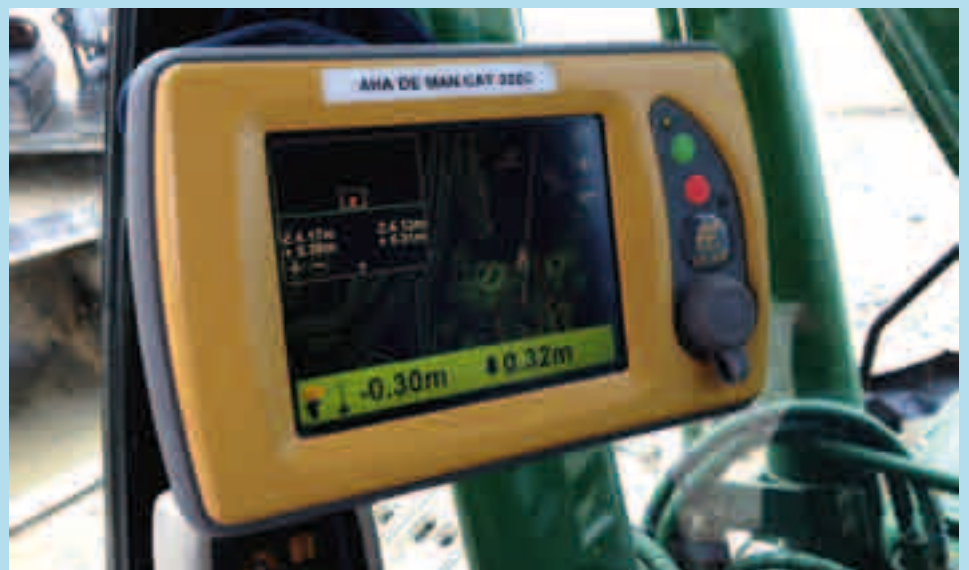
Wegens de grote oppervlakte van het golfterrein worden vijvers, dalen, glooiingen enz. aangelegd op basis van gps-gegevens.