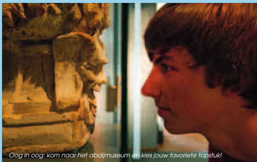
Oog in oog: kom naar het abdijsmuseum en kies jouw favoriete topstuk!

Meer info: info@tenduin.be of 058 53 39 50