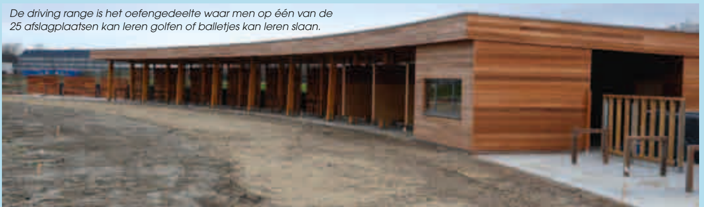
De driving range is het oefengedeelte waar men op één van de 25 afslagplaatsen kan leren golfen of balletjes kan leren slaan.

De gemeente wil van Koksijde Golf ter Hille een kwalitatief topproduct maken voor zowel eigen inwoners, 2de verblijvers als bezoekers. Naast golfen wordt aan de rand ook ruimte voorzien voor recreatief medegebruik: men zal in dit unieke decor immers ook kunnen wandelen, fietsen, vissen, zelfs picknicken... Bovendien zijn er ook plannen voor de aanleg van een aansluitende jachthaven aan de golf. Er staat dus nog heel wat werk voor de boeg!