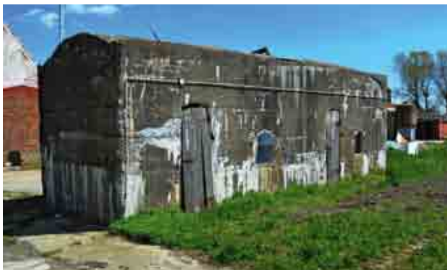
De Belgische betonnen verdedigingsconstructie uit WO I, hof Ter Bommelaere Allaertshuizenstraat 2 in Wulpen.

Voor beide nieuw beschermde monumenten geldt dat ze materiële getuigen zijn van De Grote Oorlog die de frontstreek jarenlang in zijn greep had en honderdduizenden mensenlevens verwoestte. WO I was een internationale gebeurtenis bij uitstek met o.m. de Westhoek als strijdtoneel waar honderdduizenden mannen uit de hele wereld vochten. De herinnering aan WO I kent nog steeds een breed maatschappelijk en internationaal draagvlak. Deze monumenten zijn stille getuigen die door de jarenlange inbedding in het land van de frontstreek, als het ware deel van het landschap zijn gaan uitmaken.