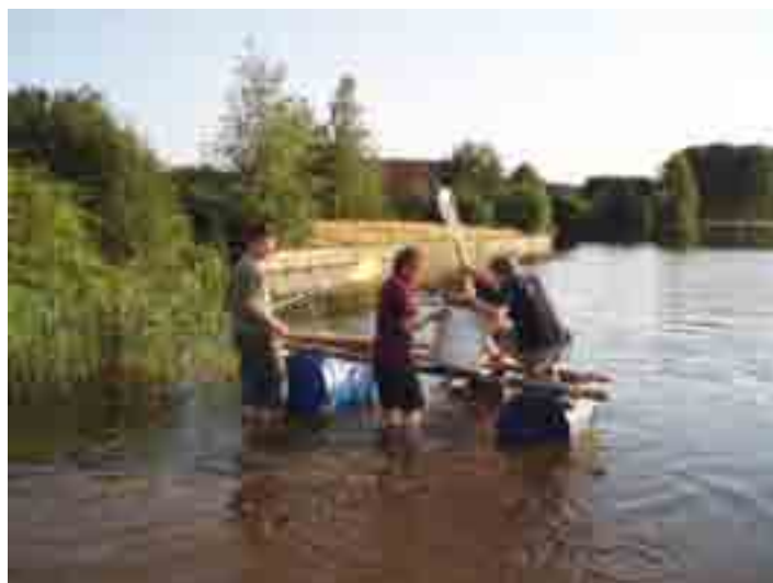
Op zaterdag 30 juni vindt in Wulpen op het kanaal Nieuwpoort-Veurne de 5de vlottenrace van KAJ-Wulpen plaats, meteen ook het 1ste Vlaams Kampioenschap.

De dag wordt afgesloten met een kippenfestijn (1/2 kip, frietjes, sausen, groenten) om 18.30 u. Deelname 12 euro pp. Deelnemen aan de vlottentocht + kippenfestijn kost 13 euro pp. Men is pas ingeschreven (zowel voor vlottenrace als kippenfestijn, tot uiterlijk 24 juni) na storting van het verschuldigde bedrag op