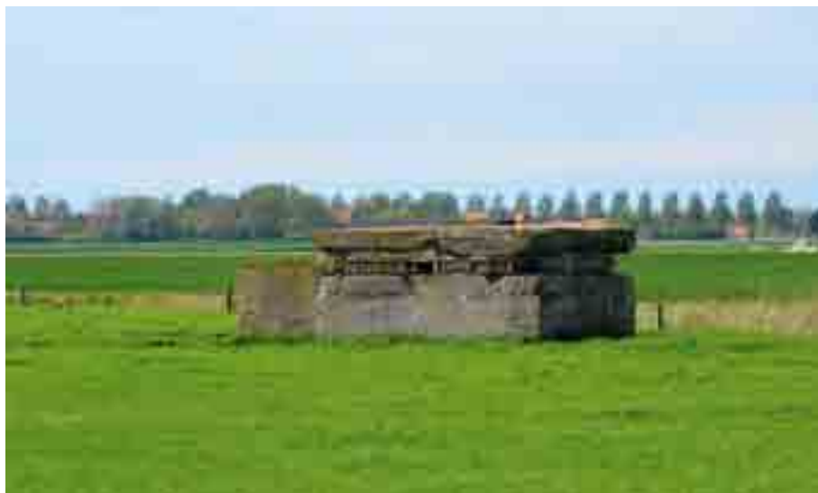
De bunkers zijn stille getuigen van WO I in de Westhoek. Door de jaren heen zijn ze deel van het landschap gaan uitmaken.

Op 21 december 2011 ondertekende Vlaams minister van Erfgoed Geert Bourgeois het besluit tot bescherming als monument van de Franse betonnen post voor radiotelegrafie uit WO I in de Polderstraat in Oostduinkerke en van de Belgische betonnen verdedigingsconstructie uit WO I, hof Ter Bommelaere Allaertshuizenstraat 2 in Wulpen.