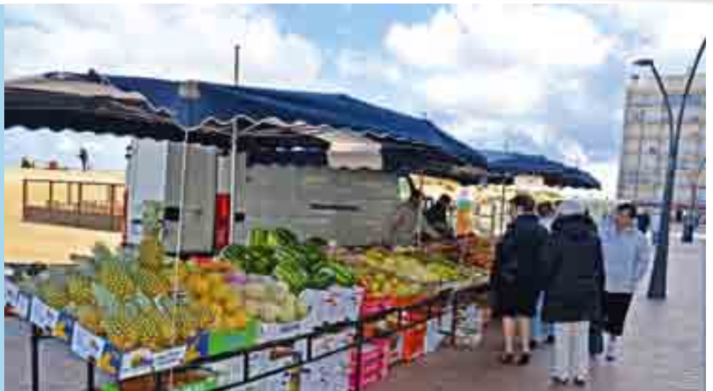
Sedert 1 mei vindt de dinsdagmarkt plaats op de Zeedijk in Oostduinkerke.

Zowel de marktkramers, de marktbezoekers als de zelfstandigen in de buurt zijn tevreden over de nieuwe dinsdagmarkt die sinds 1 mei plaatsvindt op de Zeedijk van Oostduinkerke.