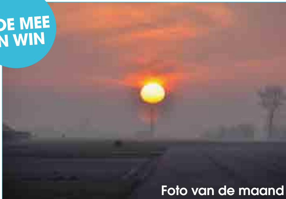
Foto van de maand