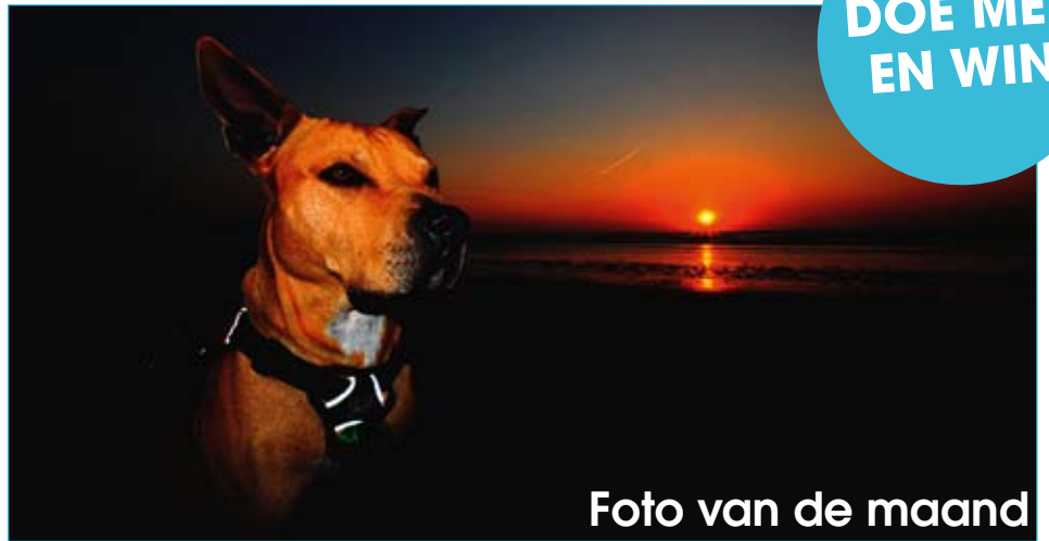
Foto van de maand