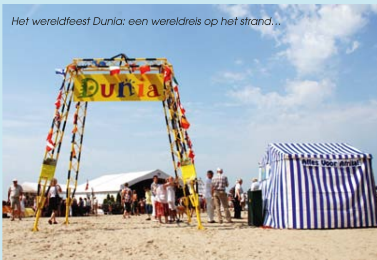
Het wereldfeest Dunia: een wereldreis op het strand...

Info: www.dis.koksijde.be bij Dunia, of bij dienstverantwoordelijke Mieke Mutton, Leopold II-laan 2 in Oostduinkerke, 0486 91 02 98, mieke.mutton@koksijde.be