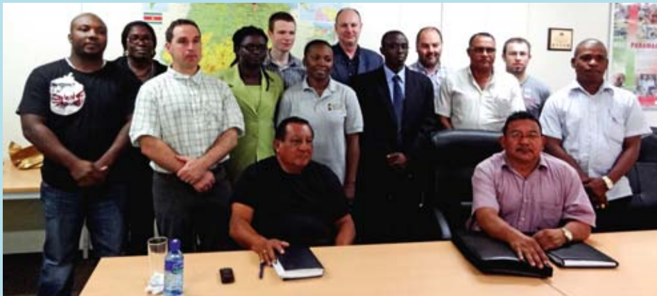
De mannen van de VMW tijdens de vergadering met de Surinaamse overheid op het kabinet van minister Betterson van het ministerie van Natuurlijke Hulpbronnen.

Onze gemeente Koksijde heeft sinds 2008 een stedenband met het district Marowijne in het Zuid-Amerikaanse land Suriname. Daarbij gaat de meeste aandacht naar het carib-indianendorp Galibi. Van meet af aan werd gefocust op een aantal domeinen zoals jeugd, visserij, toerisme, onderwijs, energie en drinkwater. Voor dit laatste item is een reuzenstap gezet: eind mei werd voor het eerst drinkwater van Moeder Aarde uit het kraantje getapt!