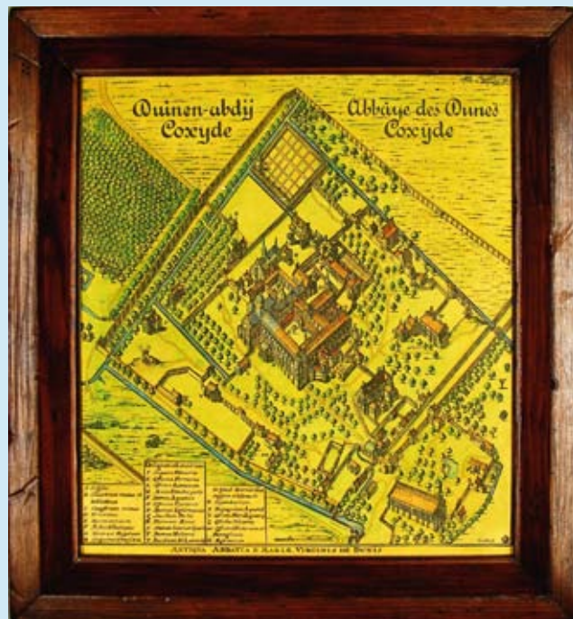
De oorspronkelijke ets van de abdij werd ruim 300 jaar geleden gekerfd door Creite. Deze afdruk dateert vermoedelijk uit begin 20ste eeuw.

voor stuk zijn de schenkingen zeer waardevol voor het erfgoed van Koksijde. Fantastisch dat mensen de moedige stap durven nemen om hun waardevol stuk vol geschiedenis te delen met de gemeenschap. Het is tevens een mooie aanvulling voor de collectie van het Abdijmuseum Ten Duinen 1138."