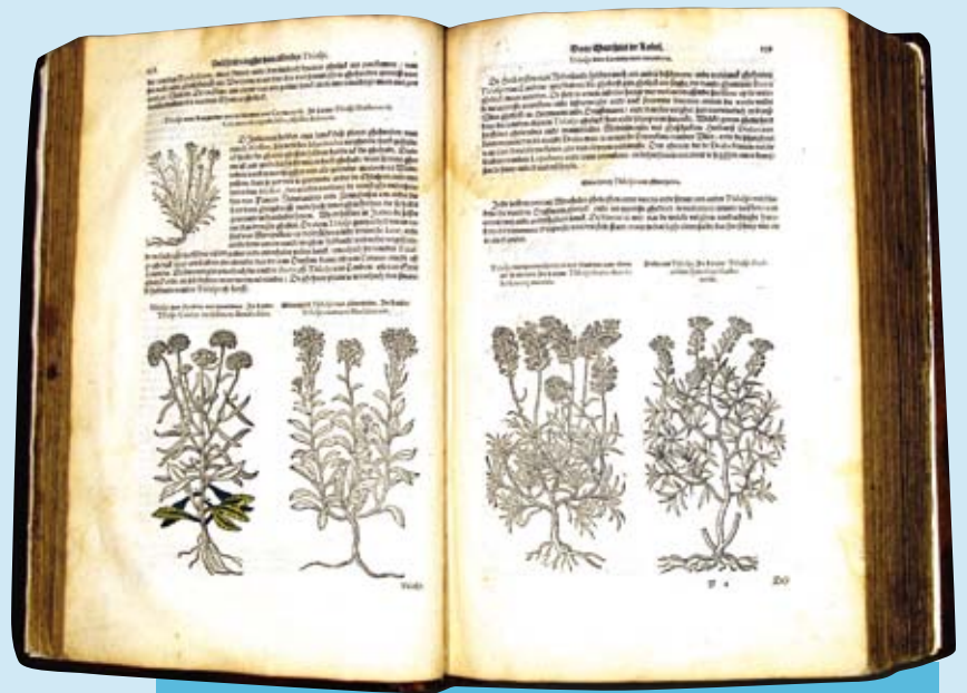
Het Kruydtboek van Matthias de Lobel, in 1581 gedrukt op de persen van Plantijn in Antwerpen.

Deze schenking kwam er dankzij sympathie voor de Vriendenkring Familiares de Dunis met haar uitstekende werking. De Vriendenkring van het Abdijmuseum viert dit jaar bovendien zijn tiende verjaardag.