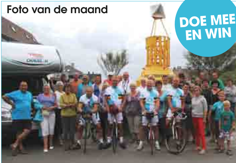
Foto van de maand