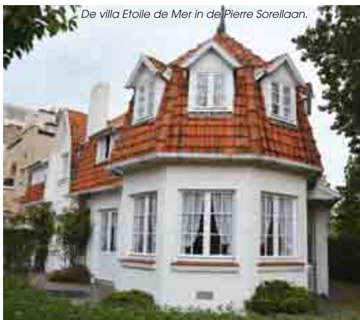
De villa Etoile de Mer in de Pierre Sorellaan.

Erfgoed - De villa Etoile de Mer, Pierre Sorellaan 14 in Koksijde, wordt toegevoegd aan de lijst met gebouwen met vier sterren in de inventaris van het bouwkundig erfgoed van de gemeente Koksijde. De woning voldoet aan de 6 criteria die opname op de lijst rechtvaardigen. Door opname op de lijst kunnen de eigenaars aanspraak maken op een gemeentelijke restauratiepremie voor waardevol niet-beschermd erfgoed.