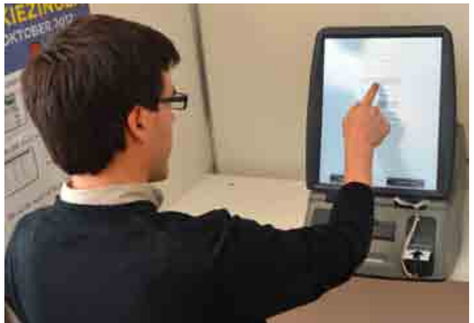
Een nieuwigheid is dat u het scherm moet aanraken met de vinger, en dus niet langer met een pen. Ook de namen, bij het geven van een voorkeurstem, dienen met de vinger aangerakt!

De Sociale Stemtest is onderdeel van het project 'Ieders stem telt'. Een initiatief van Samenlevingsopbouw en vele welzijnspartners in Vlaanderen en Brussel - www.iedersstemtelt.be