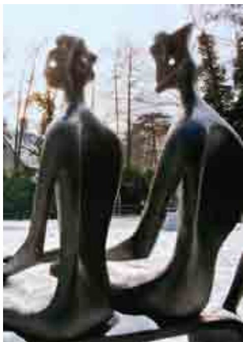
Een topstuk in Middelheim: Koning en Koningin, in de sneeuw...