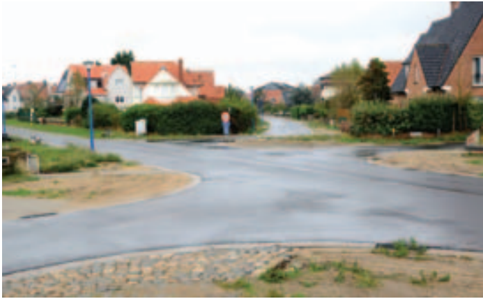
Het nieuwe kruispunt Christiaenlaan - Koninginnelaan bij de Keunekapel

De ingebruikneming van het wegenisgedeelte van dit project vond eind oktober plaats. De werken die nu nog moeten uitgevoerd worden situeren zich uitsluitend ter hoogte van het pompstation op de hoek Myriamweg-Zeepannelaan. Dit zal echter wel nog beperkte hinder met zich brengen, bv. het afsluiten van de straat.