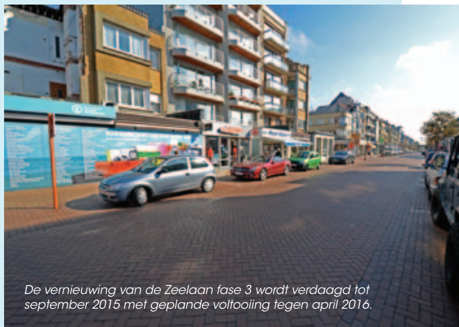
De vernieuwing van de Zeelaan fase 3 wordt verdaagd tot september 2015 met geplande voltooiing tegen april 2016.

Daarnaast biedt dit uitstel ook de mogelijkheid om voldoende tijd te nemen om aan te besteden, waardoor de aannemer die belast wordt met de uitvoering, meer tijd beschikbaar heeft om de nodige materialen op voorhand te bestellen.