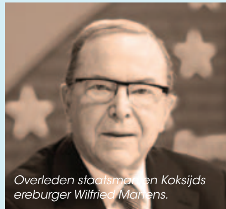
Overleden staatsman en Koksijds ereburger Wilfried Martens.

Ons gemeentebestuur wenste de familie van Wilfried Martens veel sterkte toe bij dit heengaan.