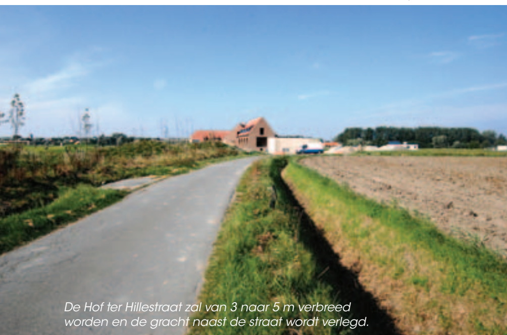
De Hof ter Hillestraat zal van 3 naar 5 m verbreed worden en de gracht naast de straat wordt verlegd.

Het autonoom gemeentebedrijf (AGB) wordt aangesteld als aanbestedende overheid. De aanbesteding kan thans plaatsvinden.