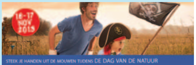
STEEK JE HANDE UIT DE MOUWEN TIJDENS DE DAG VAN DE NATUUR

Info: www.west-vlaanderen.be/dagvandenatuur.be