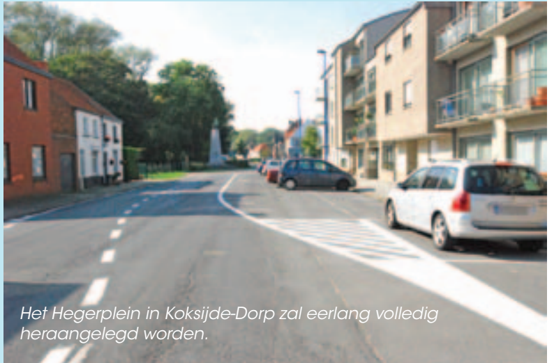
Het Hegerplein in Koksijde-Dorp zal eerlang volledig heraangelegd worden.

Volgende stap in dit dossier is het uitschrijven van de openbare aanbesteding.