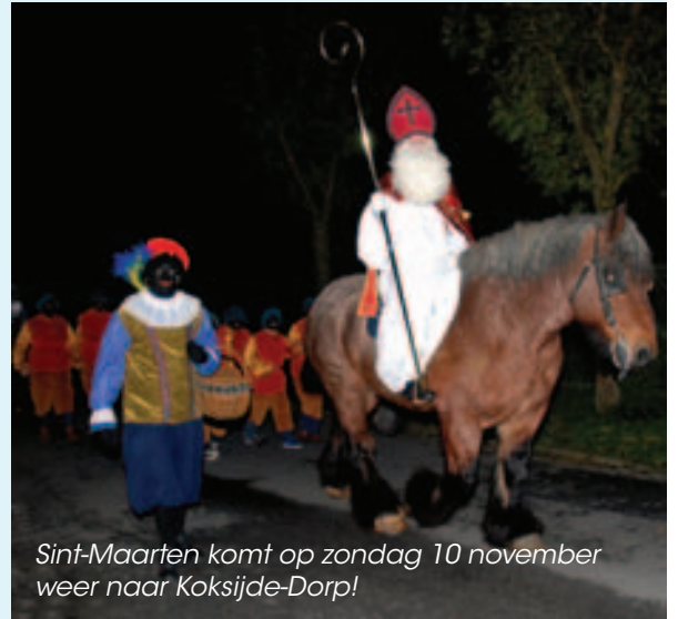
Sint-Maarten komt op zondag 10 november weer naar Koksijde-Dorp!

Org. Feestcomité Koksijde-Dorp in samenwerking met de dienst Toerisme.