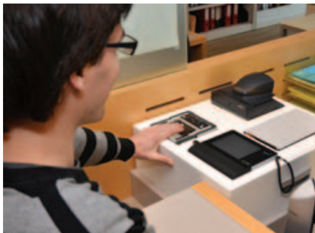
Het toestel om het nieuw type reispaspoorten aan te maken.

Info: dienst Burgerzaken, T 058 53 34 32, bevolking@koksijde.be