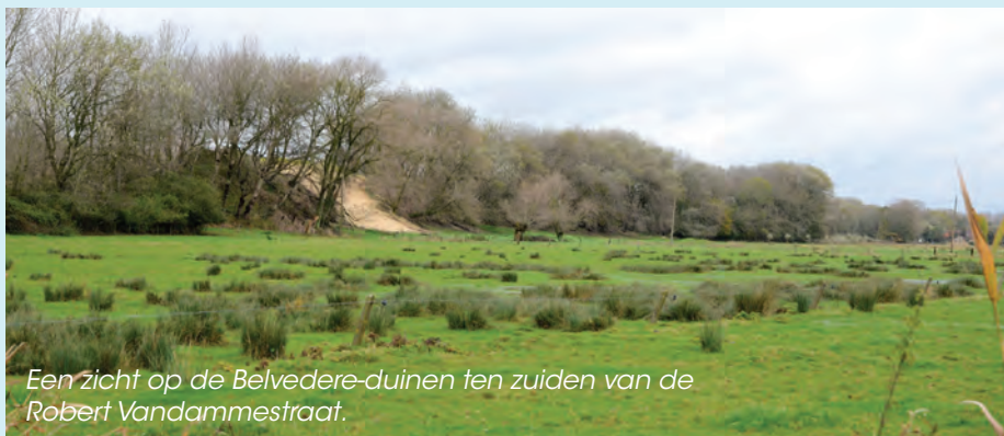
Een zicht op de Belvedere-duinen ten zuiden van de Robert Vandammestraat.

Doel ervan is de archeologische waarden van de zone te kennen. De afwerking van het beheerplan is gepland midden 2014. De raming voor de opmaak bedraagt 70.920 euro (excl. BTW), waarvan 80% of 68.651 euro door het Vlaamse Gewest gesubsidieerd wordt. Het gebied is ongeveer 132 ha groot en omvat de duinen ten zuiden van de Robert Vandammestraat, het Vlaamse natuurreservaat Belvédère en de polders met de site Ten Bogaerde. Dit gebied heeft belangrijke historisch-archeologische, erfgoed-bouwkundige, landschappelijke en natuurwaarden. Het kent diverse beschermingen als landschap, monument en dorpsgezicht.