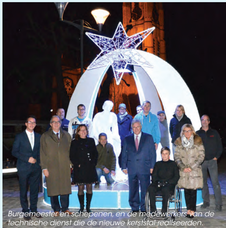
Burgemeester en schepenen, en de medewerkers van de technische dienst die de nieuwe kerststal realiseerden.

Volgende plaatsen zijn zeker ook een bezoekje waard: het kunstwerk de Poort, het Theaterplein, de verlichte kokers binnenin het gemeentehuis, de clowns op het Fabiolaplein in Oostduinkerke-Bad, de golfende kerstman in Oostduinkerke-Dorp en het Delvauxtreintje in Sint-Idesbald.