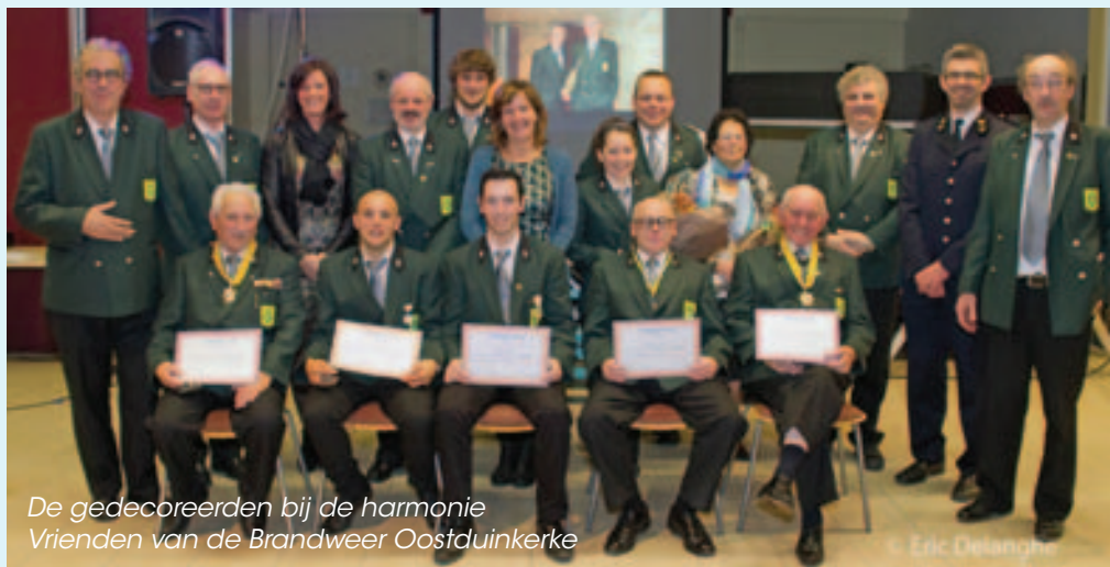
De gedecoreerden bij de harmonie Vrienden van de Brandweer Oostduinkerke