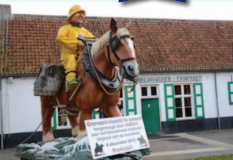
De reuzenpaardenvisser Kos deelt ook in de feestvreugde.

met de natuur en het universum, (5) ambachtelijke vaardigheden en technieken. De paardenvisserij hoort zowel thuis in de vierde als de vijfde categorie. Bij ICE wordt niet gesproken van "werelderfgoed". Deze term is voorbehouden voor onroerend erfgoed, nl. gebouwen en monumenten. De enige juiste term voor onze verworven erkenning is Garnaalvisserij te paard in Oostduinkerke toegevoegd door UNESCO aan het Immaterieel Cultureel Erfgoed van de Mensheid. Dit doet nochtans niets af van het mondiaal karakter van de erkenning, het blijft dus een erkenning op wereldniveau.