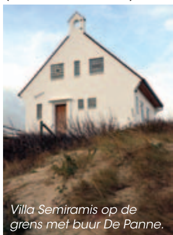
Villa Semiramis op de grens met buur De Panne.

Golf - De algehele voltooiing van Koksijde Golf Ter Hille nadert. Er resten nog volgende delen: aanleg van de parking naar het clubhuis, de omgevingswerken rond het clubhuis, de meerwerken bij de terreinaanleg en het clubhuis, de voltooiing van het clubhuis zelf. De investering wordt geraamd op 4.200.000 euro. Beheerder en bouwheer van het domein is het Autonoom Gemeentebedrijf (AGB) Koksijde. Om de financiering mogelijk te maken wordt voorzien in een kapitaalbreng door de gemeente in het kapitaal van het AGB voor een bedrag van 4.200.000 euro, waarvan onmiddellijk een vierde wordt volstort. Latere volstortingen worden goedgekeurd door het college van burgemeester en schepenen. Goedgekeurd met 19 stemmen voor (fracties LB en N-VA) en vier tegen (Impuls).