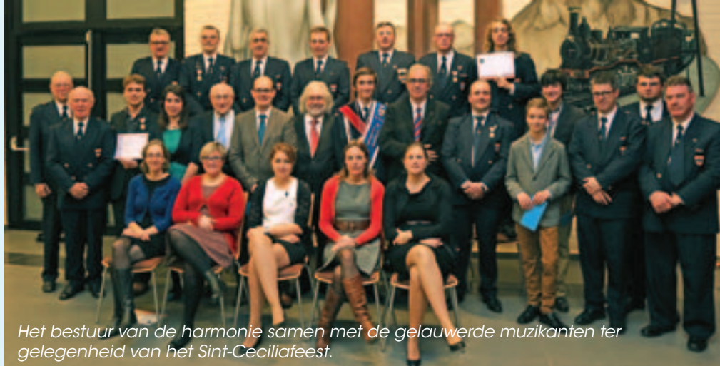
Het bestuur van de harmonie samen met de gelauwerde muzikanten ter gelegenheid van het Sint-Ceciliafeest.

Op zaterdag 18 januari speelt de harmonie om 20 u. in de theaterzaal van c.c. Casino z'n jaarlijks nieuwjaarsconcert. Op het programma staat werk van enkele van de meest tot de verbeelding