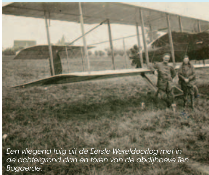
Een vliegend tuig uit de Eerste Wereldoorlog met in de achtergrond dan en toren van de abdijhoeve Ten Bogaerde.