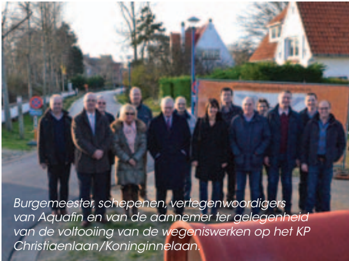
Burgemeester, schepenen, vertegenwoordigers van Aquafin en van de aannemer ter gelegenheid van de voltooiing van de wegeniswerken op het KP Christiaenlaan/Koninginnelaan.

Bijna een jaar lang hebben Aquafin en het gemeentebestuur een beroep gedaan op het geduld en het begrip van de inwoners van de betrokken straten om het project "persleiding" te kunnen uitvoeren. Uit dank daarvoor werden ze op maandag 9 december door Aquafin een drankje in het gemeentehuis aangeboden.