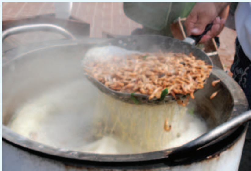
Levende vers gevangen en gekookte garnalen van de paardenvissers, een eeuwenoude overgeleverde traditie en ambacht.