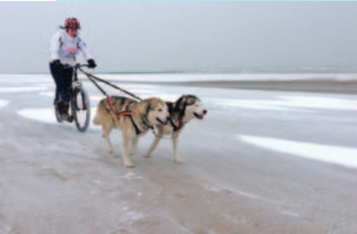
Prachtige sledehonden op zaterdag 25 en zondag 26 januari op het strand tussen Ster der Zee en Sint-André.

Op het strand van Koksijde vinden op zaterdag 25 en zondag 26 januari voor de tweede keer sledehondenrennen plaats. Het betreft een internationale manifestatie met als naam Koksijde Sleddog Race, georganiseerd door de vzw Mushing Belgium. Precieze plaats van het gebeuren is het strand van Ster der Zee tot Sint-André, heen en terug over een afstand van zes kilometer.