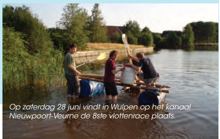
Op zaterdag 28 juni vindt in Wulpen op het kanaal Nieuwpoort-Veurne de 8ste vlottenrace plaats.

Info: jonas.fabel@telenet.be of T 0473 96 18 73, www.fisten.be/vlottenrace , Meester Vlaemyncklaan 22 Adinkerke.