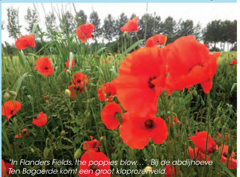
"In Flanders Fields, the poppies blow..." Bij de abdijhoeve Ten Bogaerde komt een groot klaprozenveld.

Klaprozen zijn in het Verenigd Koninkrijk en in andere landen van het Gemenebest het symbool van de Eerste Wereldoorlog omdat ze op de Vlaamse slagvelden bleven bloeien ondanks de totale verwoesting van de terreinen. De Britten noemen ze "poppies". Het betrokken veld is 50 bij 40 m groot. De bezoeker zal er op een slingerend pad in kunnen wandelen. Om het initiatief te duiden worden er ook drie infoborden geplaatst. Een eerste bord zal algemene en botanische info over klaprozen geven. Het tweede bord belicht de Canadese militaire arts John Mc Crae (1872-1918). Hij schreef het gedicht In Flanders Fields . Het gedicht zal in het Engels en in het Nederlands op het bord staan. Op het derde infobord komt info over de luchtmachtbasis Koksijde tijdens WO I met uitleg over de feiten die er zich hebben afgespeeld. Als alles volgens planning verloopt zal het veld vanaf eind juni tot eind augustus helemaal rood kleuren.