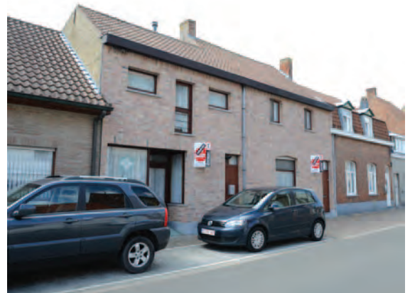
De woning Schoolstraat 5 in Oostduinkerke-Dorp.