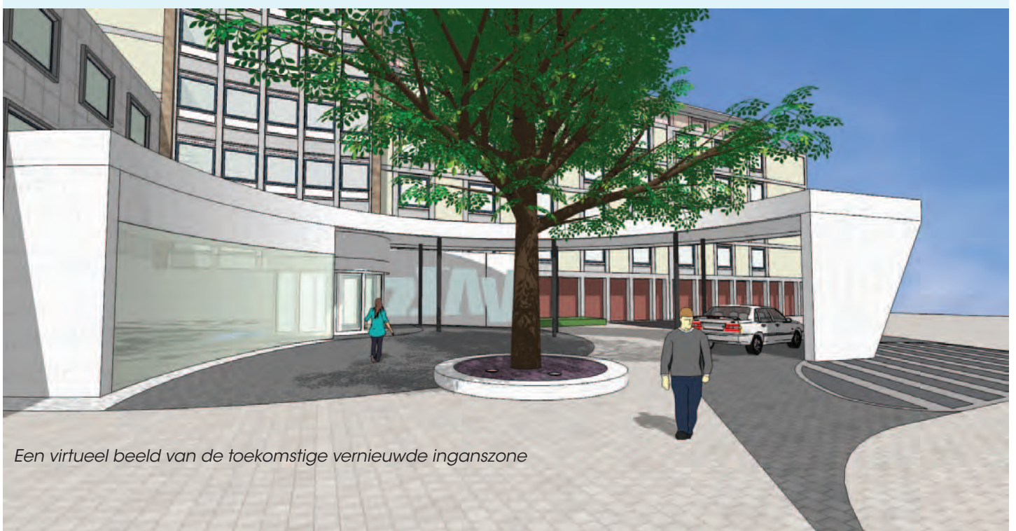
Een virtueel beeld van de toekomstige vernieuwde inganszone