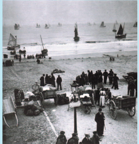
Oktober '14. Vluchtelingen uit alle hoeken van België zoeken een toevlucht zochten op het strand van De Panne, wachtend op een vissersboot die hen naar Engeland of Frankrijk kan meenemen. (Foto Koninklijk Museum van het Leger en de Krijgsgeschiedenis).

TIP! NAVIGO-arrangement: bezoek de tentoonstelling en geniet op het binnenplein van het museum van een exclusieve vissersbrunch van het Estaminet In De Peerdevisscher, op zomerse vrijdagen (11 juli tot 22 aug.) van 11 tot 13 u. Reservatie verplicht (in het NAVIGO-museum), ten laatste op woensdag. Prijs 20 euro, 16 euro voor jongeren tussen 12 en 26 jaar en 11 euro voor kinderen tot 12 jaar.