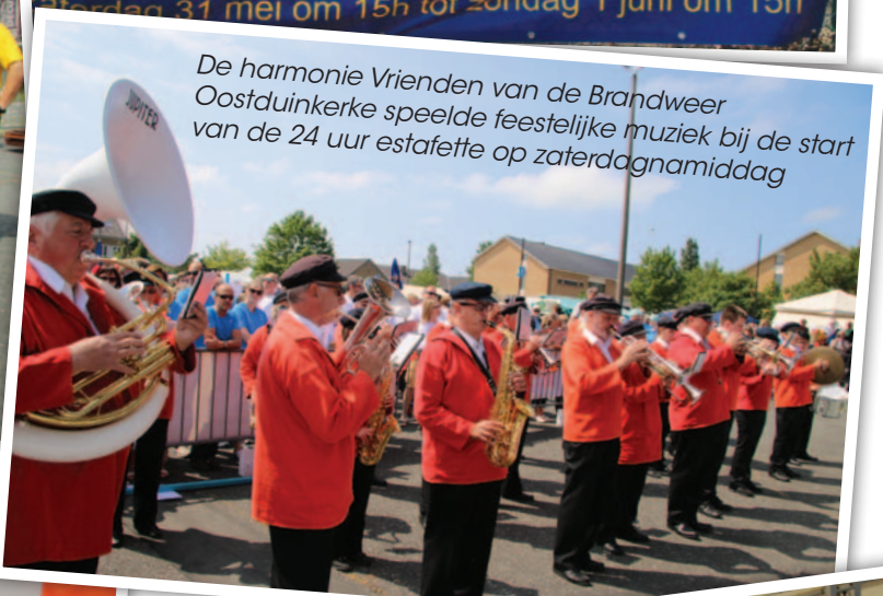
De harmonie Vrienden van de Brandweer Oostduinkerke speelde feestelijke muziek bij de start van de 24 uur estafette op zaterdagmiddag