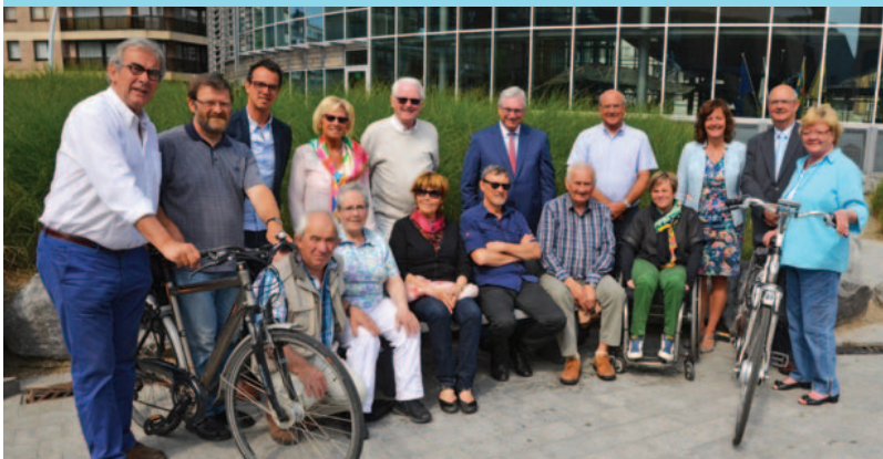
De organisatoren van de fietszoektocht in gezelschap van het college van burgemeester en schepenen.

Het traject van ca. 35 km loopt langs verscheidene bezienswaardigheden zoals o.a. de Hoge Blekker, de Zuid-Abdijmolen, de gerestaureerde Sint-Pieterskerk, het Florishofmuseum, de Sint-Willibrorduskerk, de Florizoonebrug, Koksijde Golf ter Hille, Navigo-museum, Abdijmuseum Ten Duinen, het Paul Delvauxmuseum,