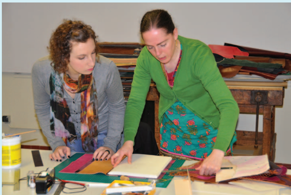
Het bundelen van papier, documenten enz. is een boeiend avontuur, een oud ambacht dat weer in de kijker komt.

De opleiding boekkunst staat naast de andere ateliers van de hogere graad (schilderkunst, beeldhouwkunst, tekenkunst...) maar wordt onderverdeeld in diverse kortlopende cursussen die ook allemaal na elkaar gevolgd kunnen worden. Een opleiding duurt zes jaar. De eerste twee jaren zijn een echte leerschool waarin een basispakket aan technieken aangeboden wordt. Het eigenlijke creatieve proces start pas in het 3de en 4de jaar. In het 5de jaar gaat de leerkracht zijn cursist meer en meer persoonlijk begeleiden i.p.v. sturen. In de specialisatiegraad komt men tot een volwaardig eindproduct en presentatie.