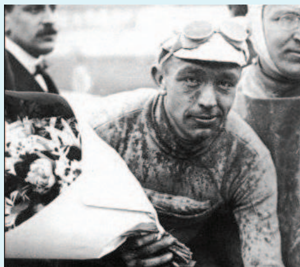
Onze landgenoot Philippe Thys won in 1914 de Ronde van Frankrijk.