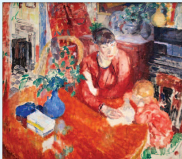
Het werk 'De opvoeding' van de Belgische fauvist Rik Wouters.