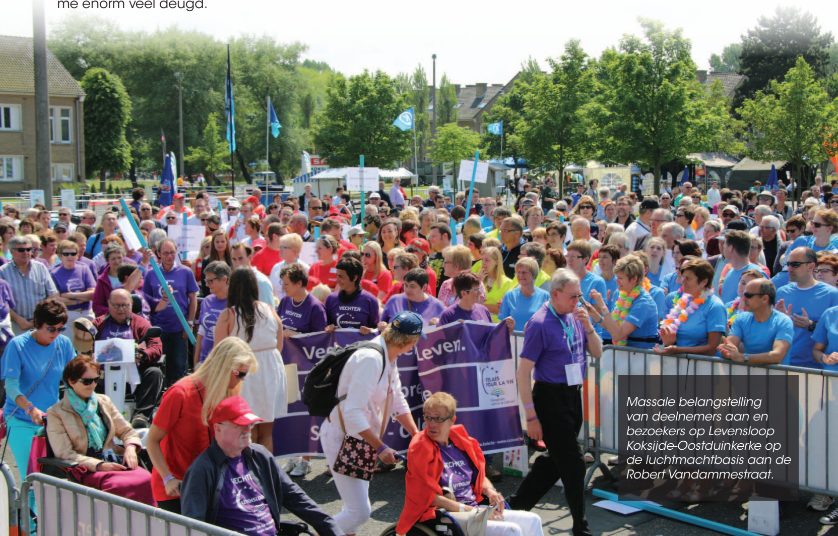
Massale belangstelling van deelnemers aan en bezoekers op Levensloop Koksijde-Oostduinkerke op de luchtmachtbasis aan de Robert Vandammestraat.