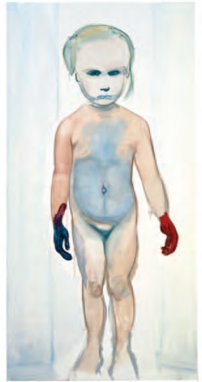
The Painter (1994) van Marlene Dumas

Info en inschrijvingen: Westhoek Academie, 058 53 27 00, westhoekacademie@koksijde.be