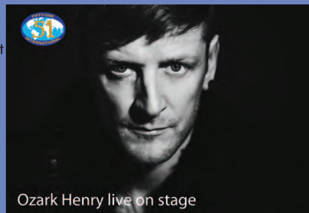
Ozark Henry live on stage

Deuren om 19.30 u. Na het concert receptie in c.c. CasinoKoksijde. Vvk 35 euro ( www.51westkust.be / dienst Toerisme, 058 51 29 10 / Verriest, Célérier & Partners, 058 51 58 32 / bij de clubleden), add 45 euro.