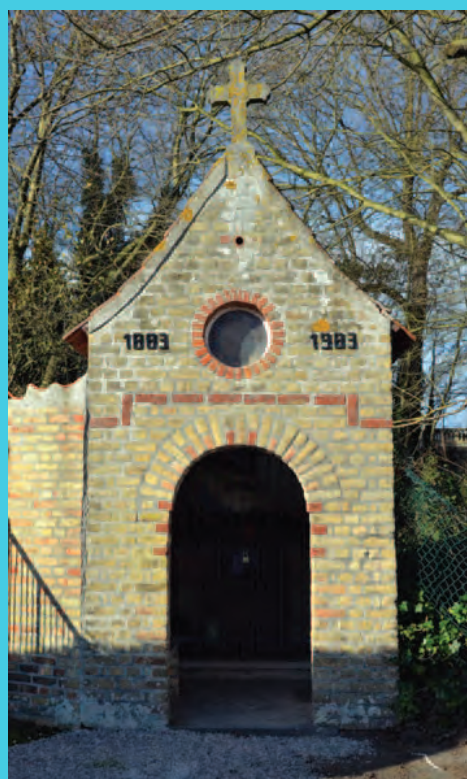
De prachtige kapel Vierval aan de Kerkstraat in Koksijde-Dorp werd grondig gereinigd en herschilderd.