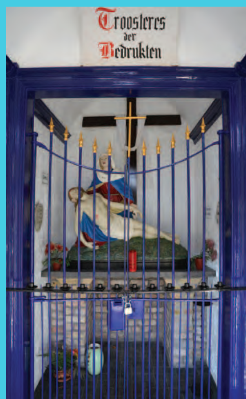
De piëta is nog steeds het oorspronkelijke beeld uit 1883.