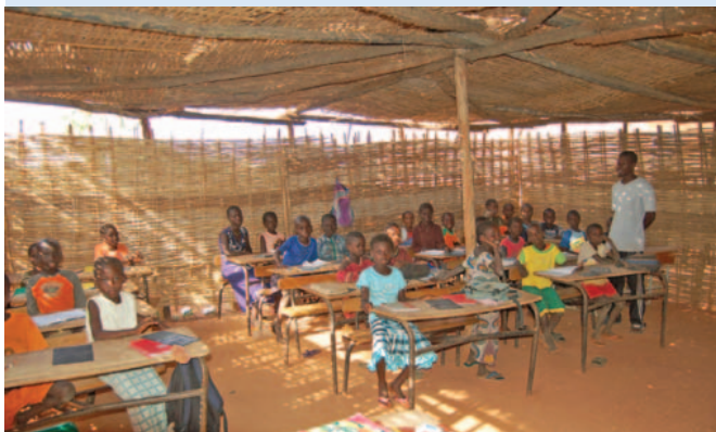
De huidige toestand van de lagere school in Sindone...