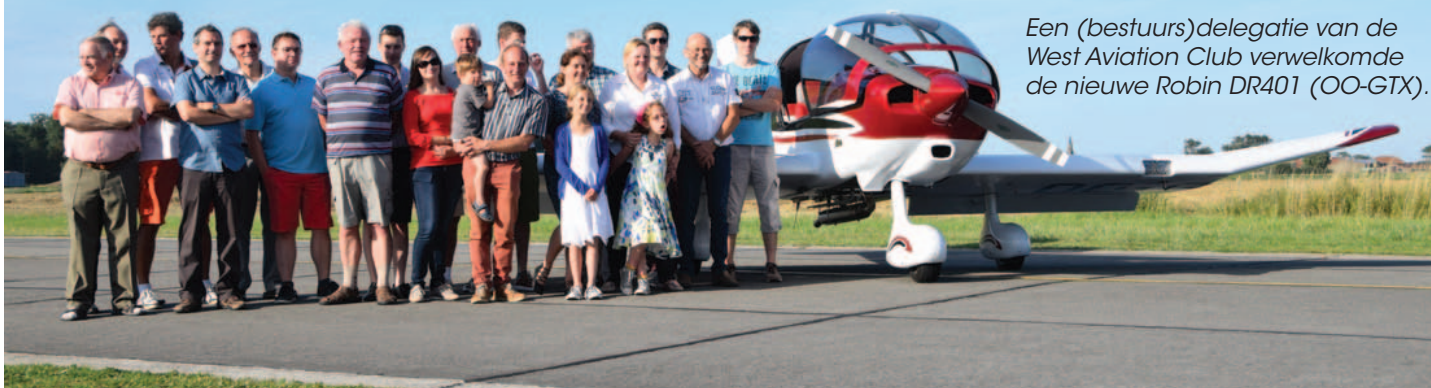
Een (bestuurs)delegatie van de West Aviation Club verwelkomde de nieuwe Robin DR401 (OO-GTX).