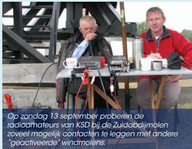
Op zondag 13 september proberen de radioamateurs van KSD bij de Zuidabdijmolen zoveel mogelijk contacten te leggen met andere "geactiveerde" windmolens.

Cursus radioamateurs - De KSD organiseert ten slotte ook een cursus om belangstellenden op te leiden om de licentie basisvergunning radioamateur te behalen. De cursus telt zes zondagen en een zaterdag, telkens van 14 tot 16 u. Start op 18 oktober in de KSD-lokalen, Erfgoedhuis (oud-gemeentehuis Oostduinkerke). De cursus is gratis. Vooraf inschrijven is gewenst: on4ksd@skynet.be of 0475 57 95 20.