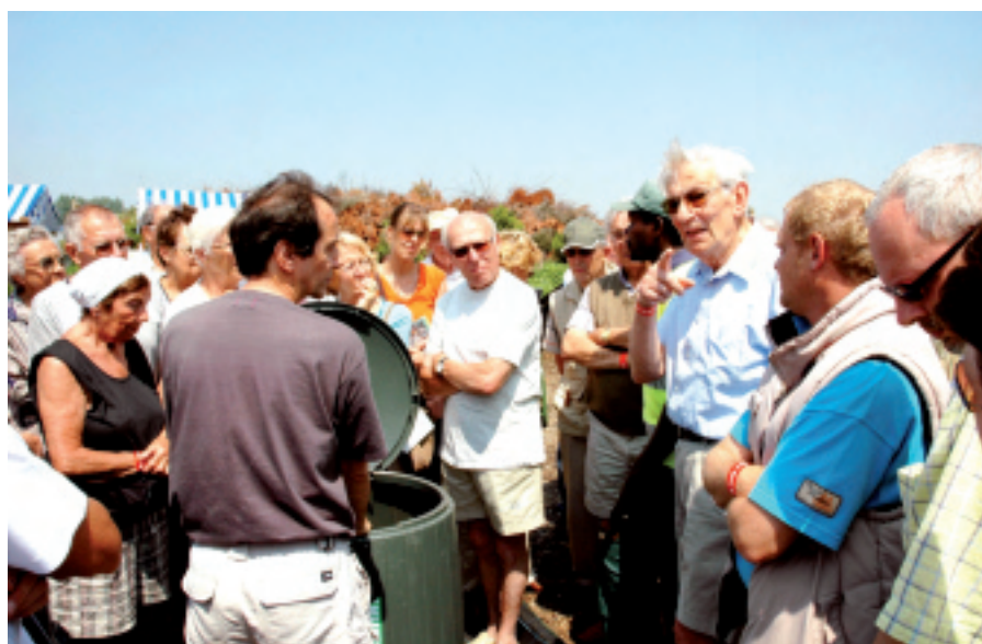
De jaarlijkse compostdag vindt plaats op zaterdag 16 juni op de compostweide bij het containerpark.

* Elke bezoeker krijgt een zakje compost mee naar huis en het gemeentebestuur biedt een drankje aan.