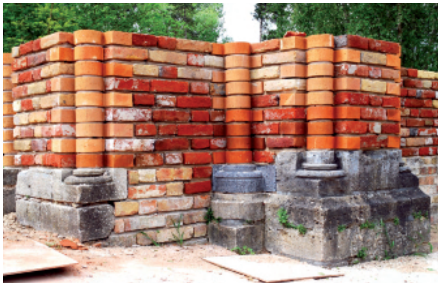
De nieuwe profielstenen geven nu een perfect beeld van hoe het voorportaal er uitzag.

Eind februari 2007 is de restauratie van de ruïnes van de kerk van de Duinenabdij weer aangevat. Deze werf heeft jaren stilgelegen als gevolg van het faillissement van de vroeger aangestelde aannemer. De firma die nu met het werk belast is, Aquastra, heeft een grondige voorbereidingsfase achter de rug waarbij de werfzones zorgvuldig werden bestudeerd.