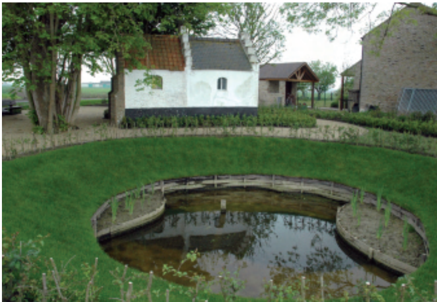
De omgeving van het Willibrordusputje werd door de gemeentelijke groendienst mooi heraangelegd.