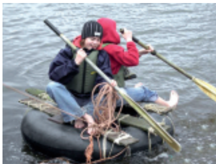
Een rivier oversteken op een zelfgemaakt vlot van een band, planken en touwen... avontuurlijker kan niet!

Expeditie@Natuur neemt de jongeren mee op een tocht door stukjes natuur in eigen streek, waar ze nog nooit geweest zijn. Een tocht te voet, met de mountainbike, in een kano of op een trapauto of zelfs met muilezels. Onderweg moeten opdrachten uitgevoerd worden en wordt informatie verzameld die nodig is om op de laatste dag "het geheim" te ontmaskeren. Elke morgen worden enkele voorwerpen aangereikt die men onderweg