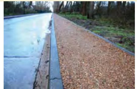
Ter hoogte van het Hannecartbos zijn nu volwaardige fietspaden in schelpenklei aangebracht.

Door de voltooiing van dit project en de heraanleg van Vrijheidsstraat (zie verder) is er nu een volledige nieuwe straat met fietsverbinding (fietspad of fietssuggestiestrook) over de volledige afstand (3 km) vanaf de Leopold II-laan tot aan de Kinderlaan. Deze realisatie past dan ook in de verdere aanleg van het kustfietsroutenetwerk. Daarnaast werd ook het project Dorpsstraat, schoolomgeving en Vrijheidstraat in Oostduinkerke-dorp plechtig geopend. Ook deze werf is voltooid met uitzondering van de asfalttoplaag en de nieuwe parking waar vroeger het monument voor