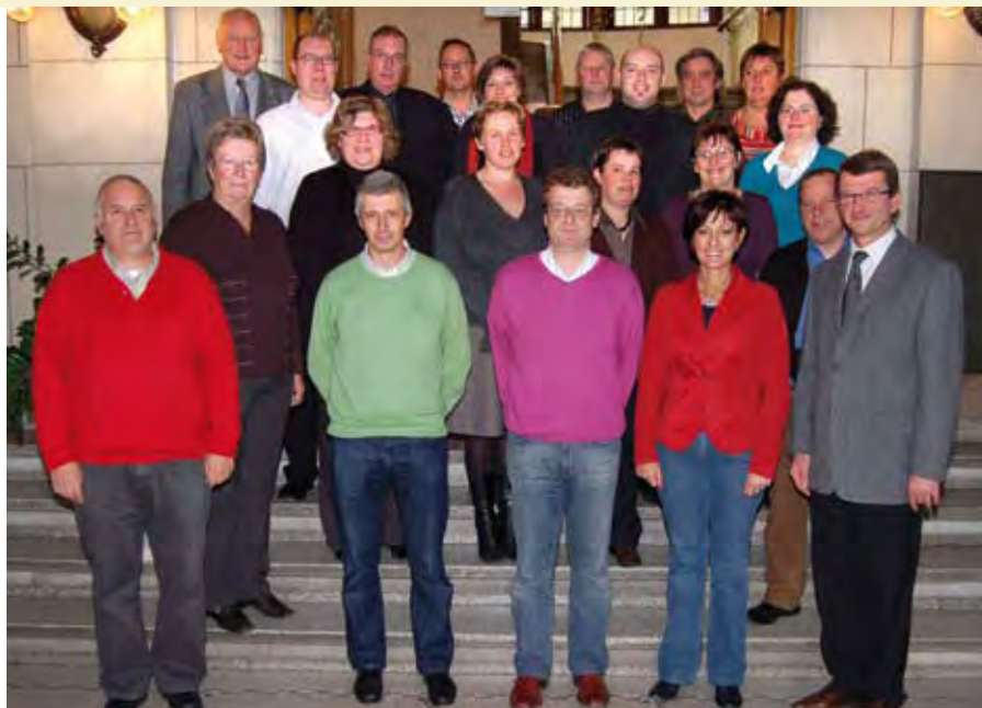
De leden van het beheerscomité van de scholengemeenschap Westhoek.

Het GOW startte in 1998 als een regionale, pedagogische begeleidingsdienst voor het gemeentelijk onderwijs in de brede regio. Deze begeleidingsdienst, die opereert onder de koepel van het Onderwijssecretariaat van het gemeentelijk en stedelijk onderwijs, zette het gemeentelijk onderwijs in de regio op de kaart en voorzag in een schoolspecifieke pedagogische begeleiding voor hun leden. Dit houdt in dat schoolbe-