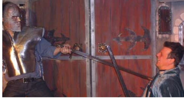
Theater Top brengt een meeslepende familievoorstelling "Kleine Arthur, Grote Koning"..!

Abdijmuseum Ten Duinen, Koninklijke Prinslaan 6-8 in Koksijde tel. 058/53.39.50, fax 058/51.00.61, e-post info@tenduin.be www.tenduin.be of www.krokuskriebels2008.be