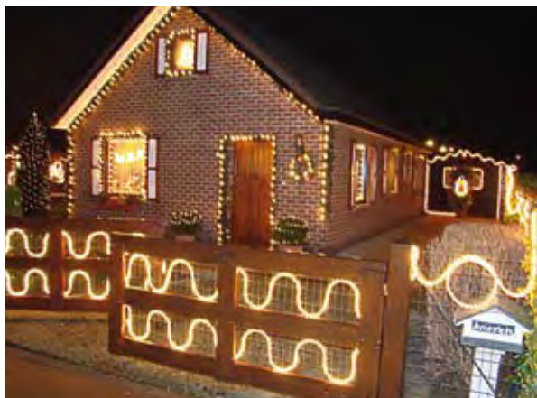
De woning van het gezin Pil-Vercruysse baadde in een zee van kerstlicht. De jury kende de bewoners de eerste prijs toe!

mers bekroond. Het zijn: 1. Pil-Vercruysse (Peerdehoek 31) / 2. Desreumaux-Coffyn (Wandelhofstraat 15) / 3. Tourlouse-Deturck (R. Vandammestraat 64) / 4. N. Marveillie (Houtsaegeerlaan 68) / 5. Eyland-Pieters (Vissersstraat 25) / 6. Mairesse-Ranson (Galopperstraat 9) / 7. Mairesse-Depoorter (Doornhofstraat 18) / 8. Jean-Pierre Inghelram (L. Hegerplein 12/0101) / 9. Johny Flahou (Abdijstraat 39) / 10. Geert Pylyser (Abdijstraat 40).