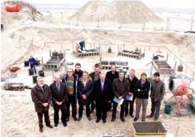
Op 29 januari vond de eerstesteenlegging van het nieuwe SYCOD plaats.

De bouw van het nieuwe windsportencentrum SYCOD (Sand Yachting Club) vormt een zeshoek, met groot terras, zitbanken en houten balustrade. De constructie wordt helemaal opgetrokken in hout. Achter het clubhuis, onder de Devoslaan, komt een grote berging voor al het materiaal met sanitair, douches, kledkamers en een leslokaal. Aannemer is de firma Braet uit Nieuwpoort voor de prijs van 935.000 euro (BTW in). Ontwerper is het ontwerp bureau Plantec uit Oostende. Het einde van de werken is voorzien voor juni 2008. Eens dit project gerealiseerd zal de gemeente beschikken over drie volwaardige accommodaties voor de windsporten op het strand en op zee: de KYC in Sint-Idesbald, Windekind op Groenendijk en SYCOD in Oostduinkerke!