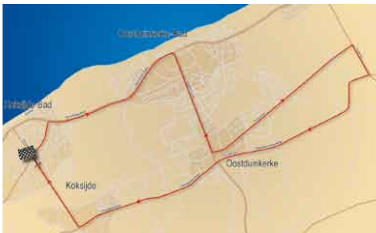
Verkeersplan voor woensdag 2 april, 2de rit Zottegem-Koksijde

* Verkeersverbod - De Zeelaan, tussen de rotonde De Poort en het kruispunt met de Middenlaan zal van 8 tot 11 u. gesloten voor alle doorgaand verkeer zijn. De nodige omleidingen zijn aangeduid. Om 13.30 u. wordt de Zeelaan van het kruispunt Abdijstraat/Pylyserlaan tot en met de rotonde De Poort en de volledige Lejeunelaan voor ALLE VERKEER AFGESLOTEN. Voor de bewoners woonachtig ten oosten van de Zeelaan, Lejeunelaan (kant Hoge Blekker) kan de wijk worden bereikt of verlaten via het kruispunt Koninklijke Baan/Dolodotlaan waar politiaanwezigheid verzekerd is.