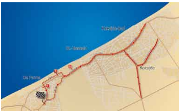
Verkeersplan voor donderdag 3 april, rit 3b, individuele tijdrit in De Panne en Koksijde