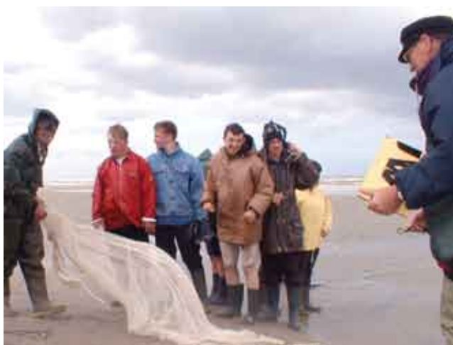
Tijdens de Week van de Zee wordt er van het jaar bijzondere aandacht geschonken aan de leerlingen van het buitengewoon onderwijs.

De milieudienst van Koksijde werkt sinds het begin mee en stelt jaarlijks, samen met de westkustgemeenten en lokale gidsen, een aanbod samen voor leerlingen uit het basisonderwijs. Daar wordt door de leerkrachten enthousiast op ingeschreven. Vooral de doe- en voelactiviteiten op het strand zijn zeer in trek. Deze groepen kunt u aan het werk zien van 28 april tot 10 mei, vooral aan het stranddienstencentrum in Koksijde-bad. Dit jaar wordt er bijzondere aandacht