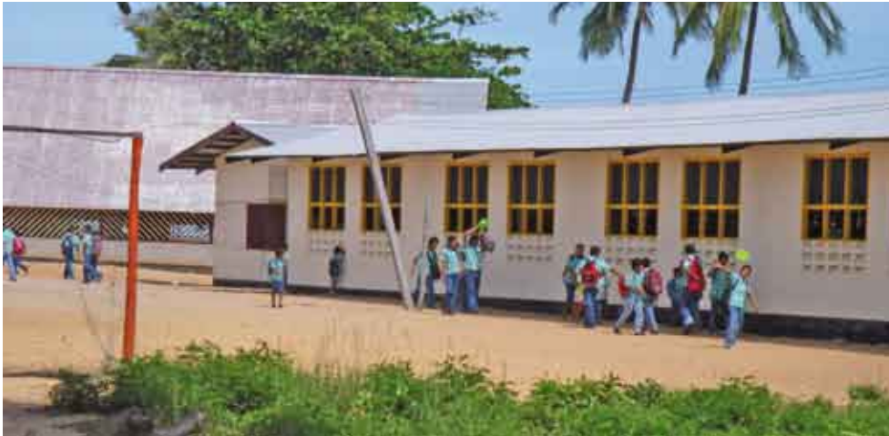
De kinderen, -let op het uniforme hemd-, gaan er naar de Sint-Antoniusschool.

verband: van partner tot partner, van bestuur tot bestuur; van collega tot collega. Deze samenwerking dient te gebeuren op gelijkwaardige basis (of toch zoveel mogelijk). De besturen doen eigenlijk aan ervaringsuitwisseling en het delen van kennis. Het is de bedoeling dat dit partnerschap met een gemeente of stad in het zogenaamde “Zuiden” gebeurt. Deze stad gaat dus ook een partnerschap aan met een gemeente in het zogenaamde “Noorden”: wij. Belangrijk hierbij is dat het bestuur en al haar diensten centraal staan. Zowel hier als in het Zuiden. De diensten en het bestuur dragen deze band, ontwerpen ze en bouwen ze uit. Het is zeker ook geen politieke uitwisseling.