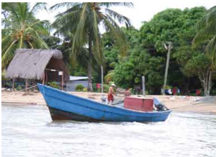
De mensen in Albina en Galibi leven o.m. van de visvangst, zoals wij vroeger...

enkele andere instelling heeft. Een goed bestuur staat voor een sterke bevolking. Want een goed bestuur is een eigen instrument dat ontwikkeling bij haar bevolking stimuleert. Dit is eigenlijk democratie: "Wat we zelf doen, doen