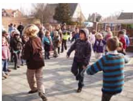
Van dansen krijg je het vanzelf warm.

Op 15 februari vond ook in onze gemeente de Dikketruiendag plaats. Bedoeling van die dag is energie besparen en tegelijk de CO 2 -uitstoot laten dalen. Dat kan gemakkelijk door enkele eenvoudige acties. Onze gemeente heeft zijn symbolisch steentje bijgedragen door de temperatuur in diverse gemeentelijke gebouwen 1 graad te verlagen (7% minder brandstofverbruik is 7% minder CO 2 -uitstoot), door de bureaulampen in het gemeentehuis die dag niet te gebruiken en door de niet-gebruikte computerschermen volledig uit te schakelen (een gewoon pc-scherm verbruikt 80 watt per uur)