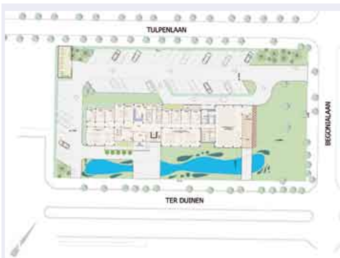
Het grondplan van het toekomstig Sociaal Huis, gesitueerd bij de serviceflats Maarten Oom, op de hoek van de Tulpenlaan en Begoniaalaan. Normaal gezien start de bouw begin 2009.

Met dit project laat Koksijde zien dat het wil investeren in welzijn. Het Sociaal Huis wordt dan ook gezien als een belangrijke meerwaarde naar de toekomst toe. De bouw start normaliter in het voorjaar 2009.