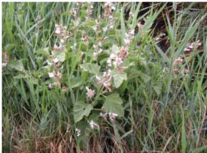
Langs de Booitshoekstraat in Wulpen groeit er voor onze streek zeldzame echte heemst, een bedreigde soort die op de rode lijst staat.

Bermen laten toe verkeersmeubilair te plaatsen, ondergrondse kabels en leidingen aan te leggen. Ze bevorderen de veiligheid bij bochten en kruispunten. Ze helpen het afstromend water van de wegverharding op te vangen. Ze bieden ruimte bij verkeerspech. Ze voorzien in een geleidelijke en veilige wegaafboording. Ze scheiden eventueel fietsers van het overige verkeer. Naast dit alles krijgen ze, door een steeds verder afnemende natuurwaarde van het achterland, een alsmear belangrijker wordende landschapsecologische of natuurfunctie!