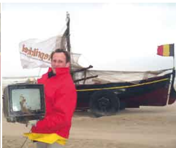
Op het strand werd zelfs een aangespoelde TV gevonden!

Lenteprikkel is de grote opruimactie op het strand in alle kustgemeenten en dus ook in Koksijde. Ondanks de onstuimige maartse buien daagden in Koksijde toch 60 moedige vrijwilligers op om 1 km strand op te ruimen. Ze kregen van een ervaren gids de nodige uitleg over natuurlijke aanspoelsels. Dankzij de storm spoelden overal massaal natuurlijke aanspoelsels aan, vooral eikapsels van wulk en sepia schelpen.