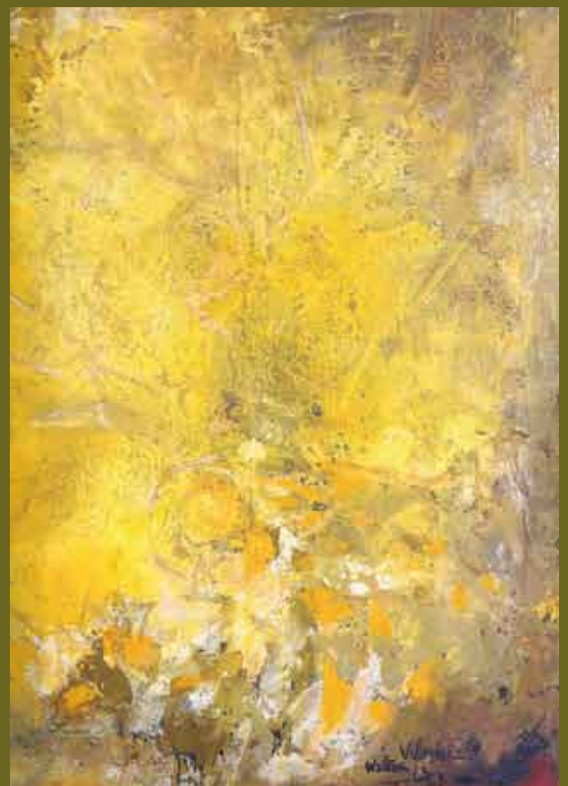
De grote bloei (1963, 171 x 135)