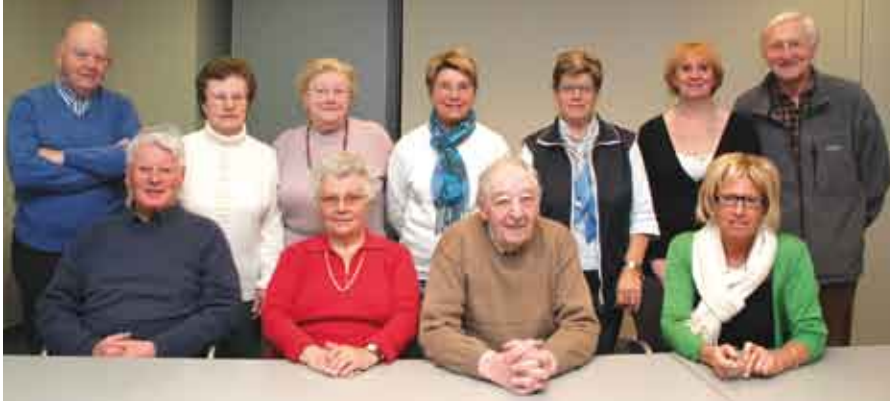
Het nieuwe bestuur van de Koksijde seniorenraad.

Sinds de oprichting in 1994 behartigt de seniorenraad de belangen van de Koksijdse senioren. Er is samenwerking en overleg met seniorenraden van andere gemeenten. De seniorenraad ijvert voor een gemakkelijker gebruik van het openbaar vervoer: aanpassing station Koksijde, lagere opstap aan tram, trein... Jaarlijks organiseert de seniorenraad in