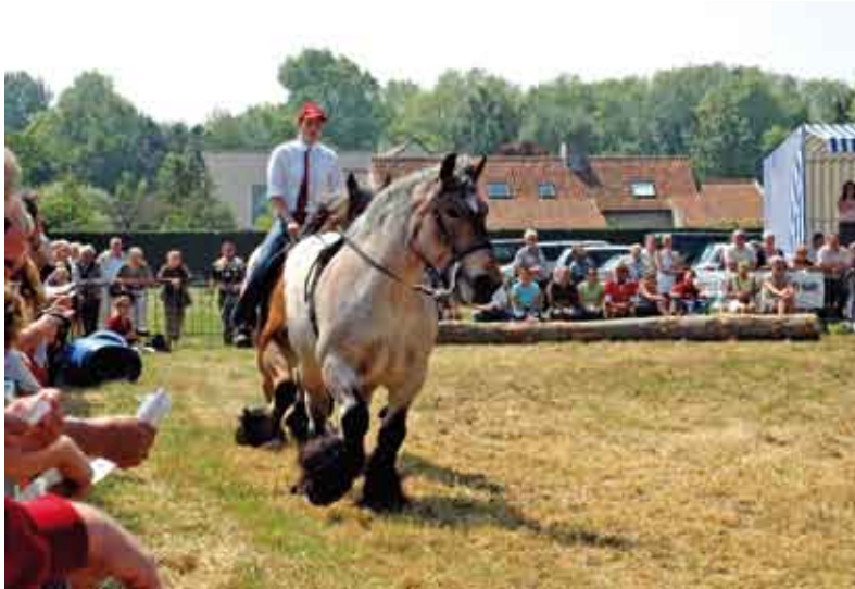
Op het trekpaardenfeest demonstreren ervaren ruiters tot welke behendigheid en snelheid de zware trekpaarden in staat zijn...