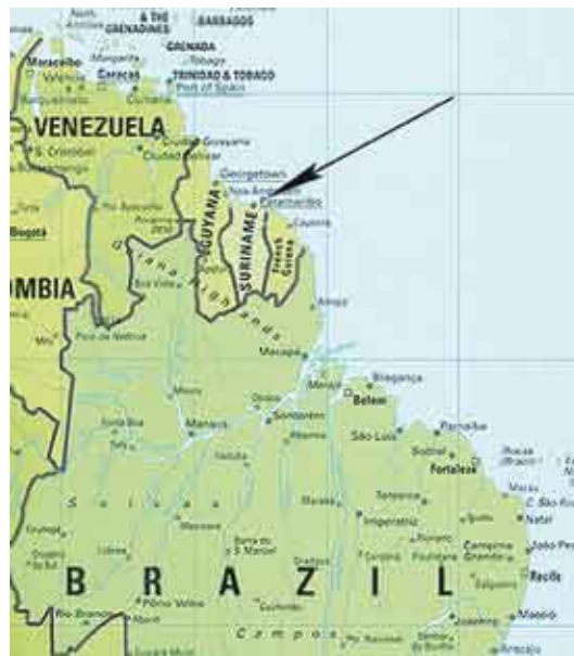
Suriname ligt aan de Atlantische Oceaan, geprangd tussen de buurlanden Guyana (links), Frans Guiana (rechts) en Brazilië (zuid). De partengemeenten Galibi en Albina liggen niet ver van de hoofdstad Paramaribo (zie pijl).