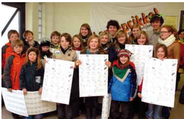
Vele kinderen kregen een mooie kaart met identificatie van natuurlijke aanspoelsels op het strand!

Tijdens de vijfde editie van Lenteprikkel op zaterdag 22 maart werd op het strand over heel de kustlijn ruim 1.000 kg afval opge-ruimd. Lenteprikkel wordt gecoördineerd door Coördinatiepunt Duurzaam Kustbeheer.