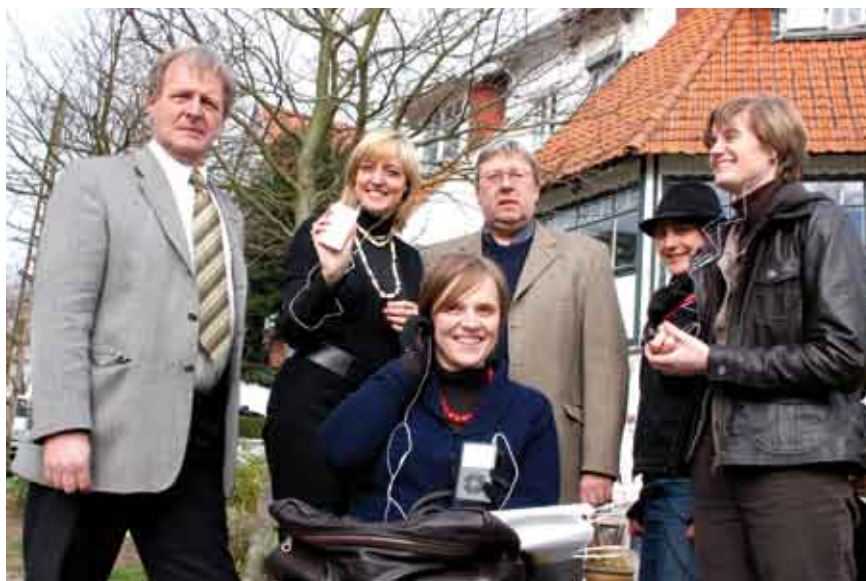
Voortaan kan de toerist de Koksijdse bezienswaardigheden ontdekken aan de hand van een digitale gids: de iPodwandelingen!

In grootsteden zijn video- en audio 'tours' reeds langer beschikbaar, maar Koksijde is de eerste gemeente aan onze kust om dit systeem in eigen beheer aan te bieden. De nadruk ligt op gebruiksvriendelijkheid en boeiende informatie, niet op techniek. Op de markt zijn zeer gesofisticeerde systemen beschikbaar die audio, video, gsm, gps en pc-functies