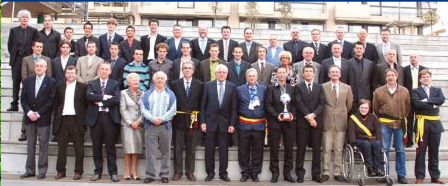
De grote KVC-familie, kampioen in 1ste provinciale 2007-2008, in aanwezigheid van het college van burgemeester en schepenen

KVV Coxyde heeft zich op autoritaire wijze door het seizoen '07-'08 gevoetbald. De cijfers spreken boekdelen: 22 gewonnen wedstrijden, slechts 5 nederlagen en 3 draws, 91 gescoorde en 30 tegendoelpunten, en uiteindelijk 69 punten of 76,6%. De Blekkerjongens rondden de competitie af met respectievelijk 4, 9 en 16 punten voorsprong op runners up Boezinge, Oostnieuwkerke en Poperinge, wat genoegzaam bewijst hoe dominant ze de voorbije acht