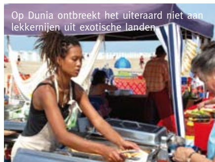
Op Dunia ontbreekt het uiteraard niet aan lekkernijen uit exotische landen