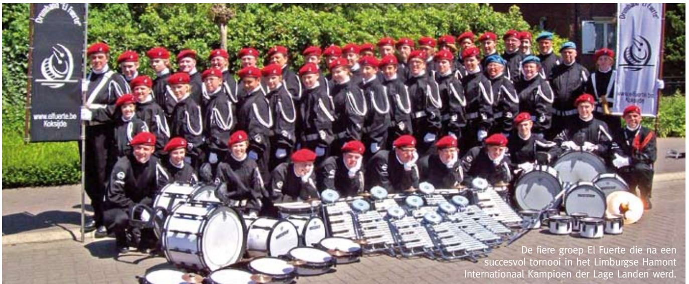
De fiere groep El Fuerte die na een succesvol tornooi in het Limburgse Hamont Internationaal Kampioen der Lage Landen werd.

Inmiddels kijkt de drumband tegen grote veranderingen aan. In september 2008 start de groep immers met blaaswerk en verandert de naam in Showkorps El Fuerte – Koksijde. De combinatie van slagwerk, lyra's en blaasinstrumenten zal een uniek concept zijn. In juni werd een grote campagne gehouden om alle muzikanten en sympathisanten in de streek op de hoogte te brengen van deze gedaantewisseling. Er werden al enkele nummers aangekocht zoals Tequila, Brand New Day, Smoke on the Water, Oye Como Va, Celebration, enz., stuk voor stuk "klassiekers" en gekende muziek. Voor meer info: www.elfuerte.be , Jurrie Delporte, Zeelaan 1, jurrie@telenet.be , gsm 0496/68.71.12.