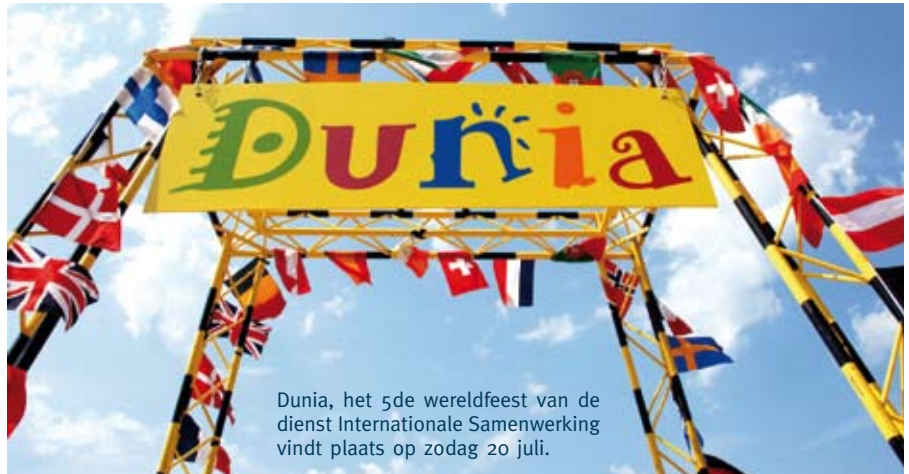
Dunia, het 5de wereldfeest van de dienst Internationale Samenwerking vindt plaats op zondag 20 juli.

Daarnaast wordt er een levendige partij live muziek aangeboden. Dunia wordt deze keer geopend door Paola's Bossa . Zij brengt pure Braziliaanse bossa nova en oude samba. Paola's stem geeft u het gevoel van serene gelukzaligheid in een andere wereld.