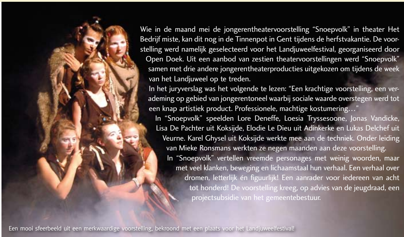
Een mooi sfeerbeeld uit een merkwaardige voorstelling, bekroond met een plaats voor het Landjuweelfestival!

Wie in de maand mei de jongerentheatervoorstelling “Snoepvolk” in theater Het Bedrijf miste, kan dit nog in de Tinnenpot in Gent tijdens de herfstvakantie. De voorstelling werd namelijk geselecteerd voor het Landjuweelfestival, georganiseerd door Open Doek. Uit een aanbod van zestien theatervoorstellingen werd “Snoepvolk” samen met drie andere jongerentheaterproducties uitgekozen om tijdens de week van het Landjuweel op te treden.