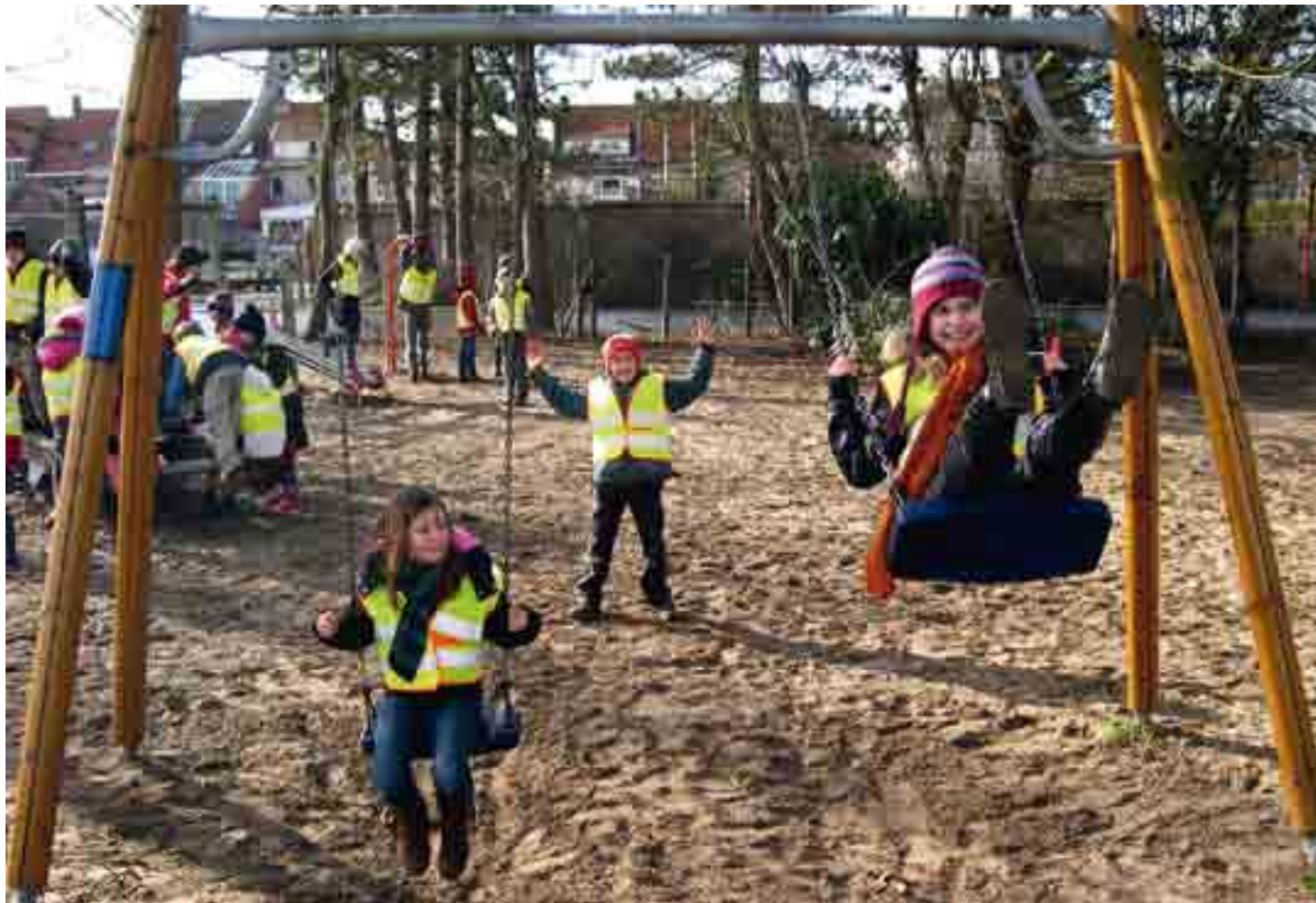
Voor de speelpleintjes bij het zwembad in Koksijde-dorp en aan de Dockaertstraat nabij de Pelikaanbrug tegenaan Nieuwpoort, worden extra speeltoestellen aangekocht!

In deze rubriek publiceert de redactie de interessantste beslissingen van de gemeenteraad. Indien het agendapunt eenparig is goedgekeurd vermelden we: unaniem. Indien het punt niet eenparig is goedgekeurd (omdat sommige raadsleden zich onthielden of tegenstemden), dan wordt dit ook vermeld. De opgegeven bedragen zijn altijd BTW in, tenzij anders vermeld.