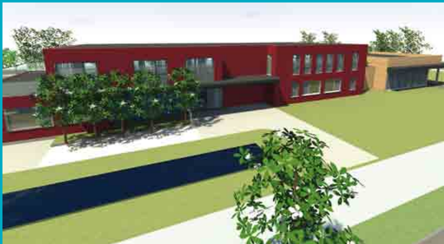
Een beeld van de toekomstige voorgevel van het Sociaal Huis. Ontwerp: architectenassociatie Ring Partners uit Antwerpen. Aannemer: firma Braet uit Nieuwpoort.

Greta: "Zeker! We zitten al 3 jaar niet stil en leggen de klemtoon vooral op huisvesting. Onlangs kocht het Sociaal Huis in de Pylyserlaan een gebouw van de gemeente voor het lokaal opvanginitiatief voor asielzoekers (zie hiernaast). Daarnaast heb ik er ook voor geijverd dat het huis in de Houtsaegerlaan (nr. 4) binnenkort zal plaatsmaken voor vijf sociale appartementen voor onze inwoners. In het Sociaal Huis werken we voor en met mensen en dat ligt me wel."