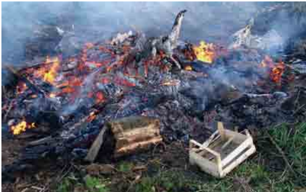
Vuurtjes stoken in de tuin is ten strengste verboden en zeer ongezond.

Afval verbranden in open lucht, haarden en kachels is dan ook terecht streng verboden. Alleen plantaardige afvalstoffen van tuinen mogen in Vlaanderen verbrand worden. Maar dan moet het wel gebeuren op meer dan honderd meter afstand van huizen, hagen, bossen, boomgaarden, In woonzones is afval verbranden helemaal niet toegelaten. Wie de geldende bepalingen aan zijn laars lapt, staat een fikse boete te wachten. Verstokte stokers wijzen er vaak op dat "hun afval anders toch ook verbrand zou worden". Deze redenering gaat niet op: de verbranding in een professionele verbrandingsinstallatie gebeurt onder gecontroleerde omstandigheden en bij zeer hoge temperatuur. Bovendien wordt de rook nog eens gefilterd waardoor de uitstoot van schadelijke stoffen minimaal is. Uit onderzoek blijkt trouwens dat één vuurtje tot zo'n 5.000 keer meer schadelijke stoffen kan uitstoten