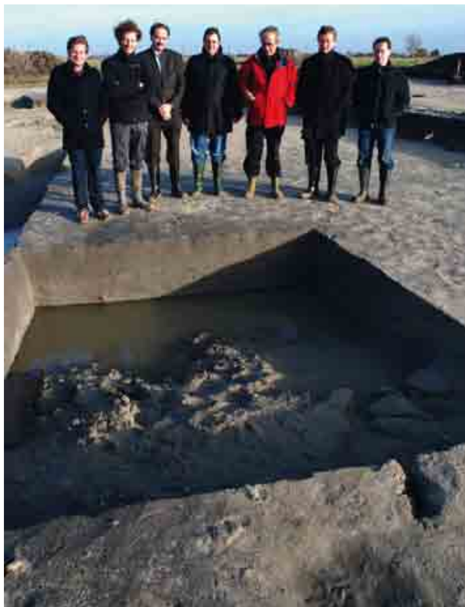
Het schepencollege brengt een bezoek aan de golfsite en krijgt ook duiding over het archeologisch project.

Sinds kort kan je op de gemeentelijke website alles over het Koksijdse golfproject ontdekken. Daartoe werd een speciale deelsite aangemaakt. Wie surft naar www.golfhofferhille.be kan er de hele evolutie van de ontwikkeling van Golf Hof Ter Hille volgen! Momenteel kom je op deze website o.a. alles te weten over de voortgang van dit dossier, hoe de plannen