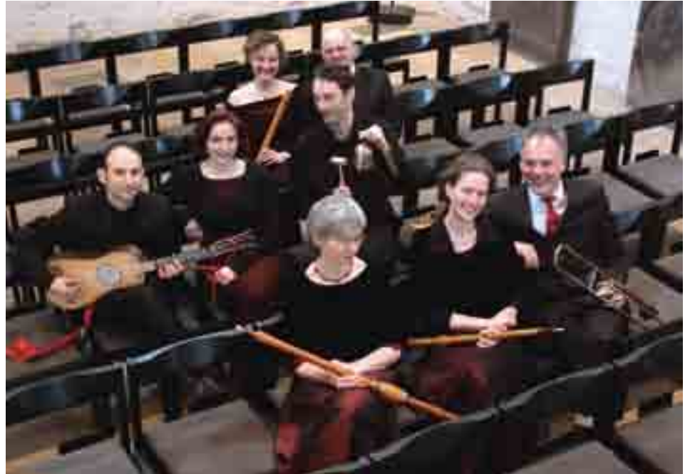
Het gezelschap Capella de la Torre brengt op zondag 13 december een boeiend middeleeuws kerstconcert in de Sint-Pieterskerk in Koksijde-dorp.

Na het optreden is er (gratis) lekkere glühwein en een lekker vuurtje. Dit indrukwekkend concert vindt plaats op zondag 13 december om