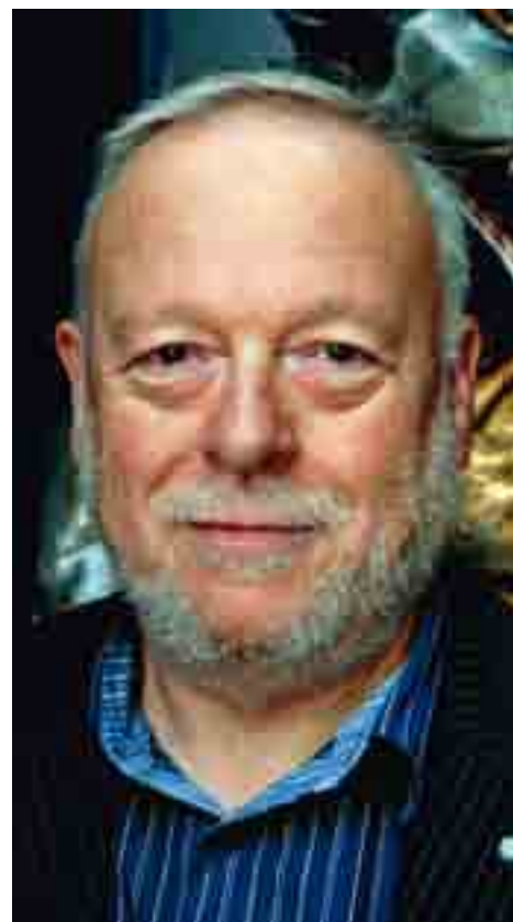
Auteur Willem Lanszweert

Tot slot nog deze krentenhistorie. Koekenbrood kwam niet aan boord van de vissersvaartuigen. Krenten zijn tranen, zo werd beweerd. Er werd ook verteld dat de krenten stenen zouden worden in de netten of nog dat de krenten in grote gaten zouden veranderen in het net. Zo is het nog gebeurd dat een kok, iemand die nog nooit gevaren