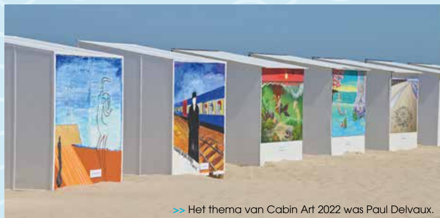
>> Het thema van Cabin Art 2022 was Paul Delvaux.