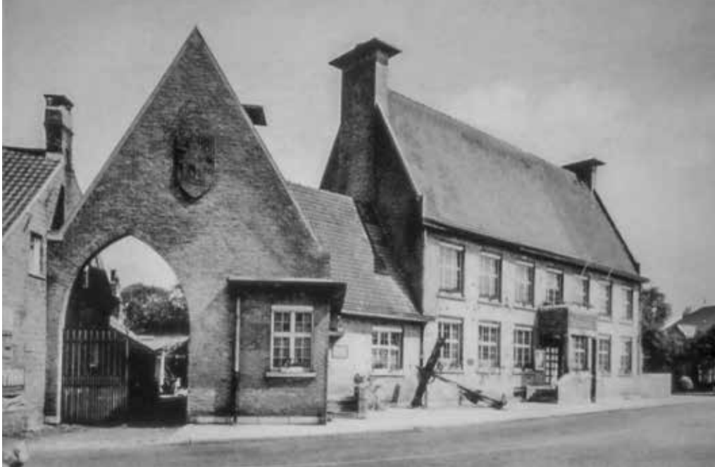
>> Erfgoedhuis Bachten de Kupe behoort tot de viersterrenwoningen