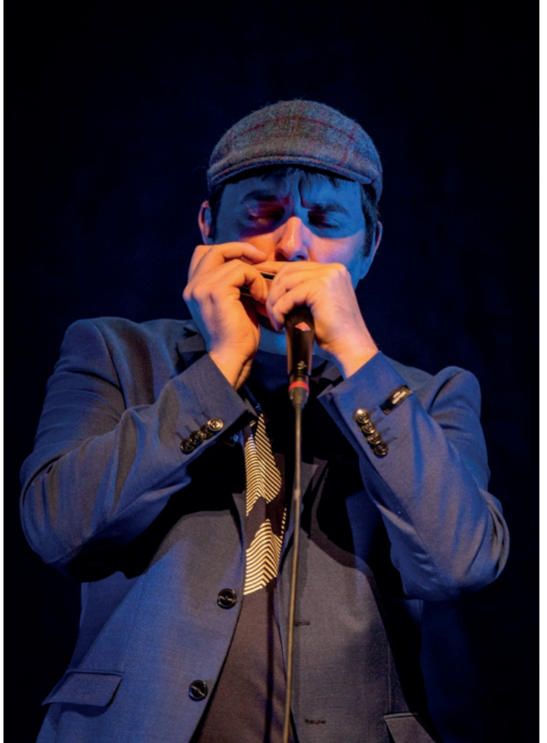
>> Ontdek op 13 februari waarom de mondharmonica symbool staat voor nostalgie, weemoed en gezelligheid

Zijn gevoelige klanken doen de haren op je lijf rechtstaan. Reserveer vandaag nog je gratis ticket: www.tenduinen.be