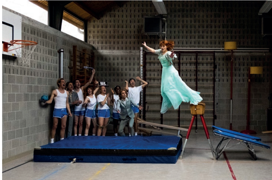
>> Een klassieker in een nieuw jasje op zaterdag 10 februari

Ontdek dit theatercollectief (vóór ze écht doorbreken) met een frisse versie van deze klassieker op zaterdag 10 februari om 20 uur. Een ticket kost 18 euro. Jonger dan 26? Dan betaal je 15 euro.