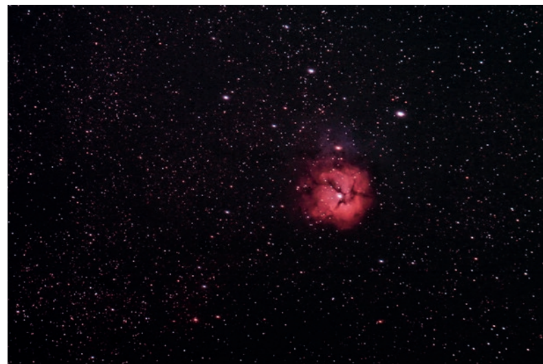
>> Een foto van de Trifidnevel

Op woensdagavond 6, 13, 20 en 27 maart van 19.30 tot 21.30 uur. Je betaalt 40 euro (UITPAS-kansentarief: 8 euro). Schrijf je nu in via desterrenjutters@gmail.com