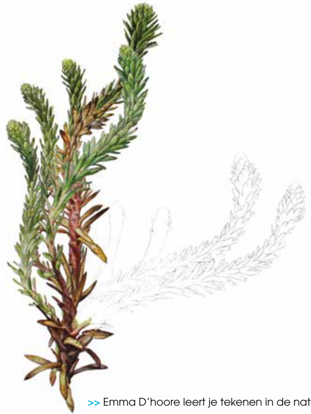
>> Emma D'hoore leert je tekenen in de natuur.

Tip: in de volgende editie van Tij-dingen lees je een interview met lesgeefster Emma D'hoore