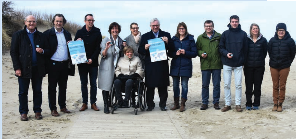
Het startschot van het project Stap de wereld rond vond plaats op maandag 6 maart op het strand van Oostduinkerke. Het schepencollege en de sportdienst zetten de eerste stappen richting Italië.