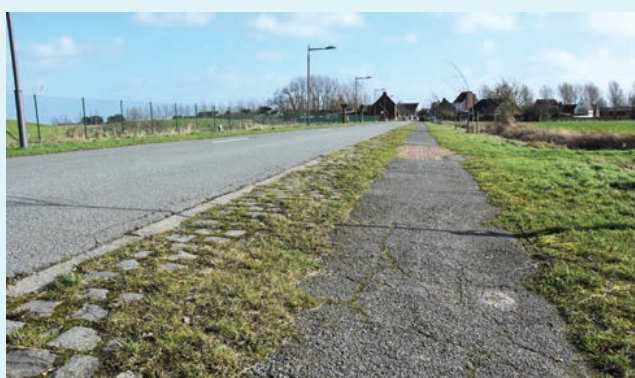
Langs de Nieuwstraat komt er een volledig nieuw tweerichtingsfietspad van 3 m breed.