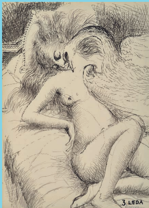
Ets Léda, 1969, Oost-Indische inkt op papier. Illustratie van een gedicht van Eluard. © Foundation Paul Delvaux

Openingsuren - 1 april-31 augustus: dinsdag-zondag, 10.30-17.30 u. / 1 september-8 januari: donderdag-zondag, 10.30-17.30 u.