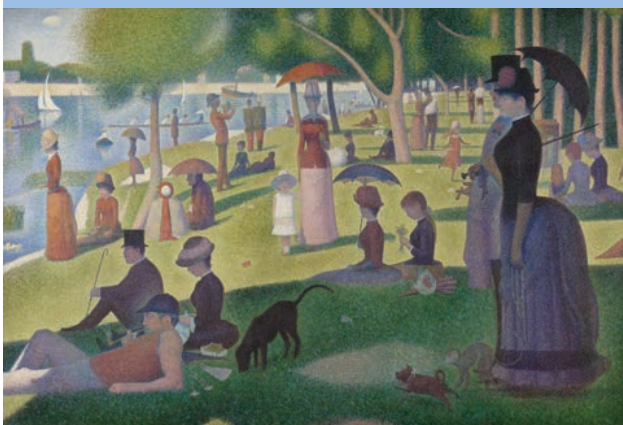
Un dimanche après-midi à l'île de la Grande Jatte van Georges Seurat die zijn nieuwste werk in 1887 tentoonstelde in het salon te Brussel. Dit schilderij maakte veel ophef. Nu behoort het tot de meesterwerken van het Art Institute of Chicago.

Info: Westhoek Academie Koksijde, Veurnelaan 109, 058 53 27 00, westhoekacademie@koksijde.be , www.westhoekacademie.be