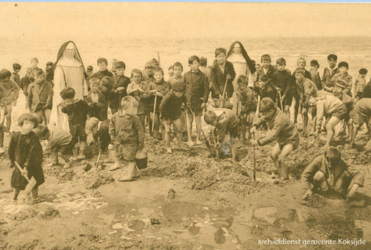
archiefdienst gemeente Koksijde

Info: dienst Archief, gemeentehuis (-1), Zeelaan 303 / Erfgoedhuis, Leopold II-laan 2, Oostduinkerke | 058 53 30 71, archief@koksijde.be