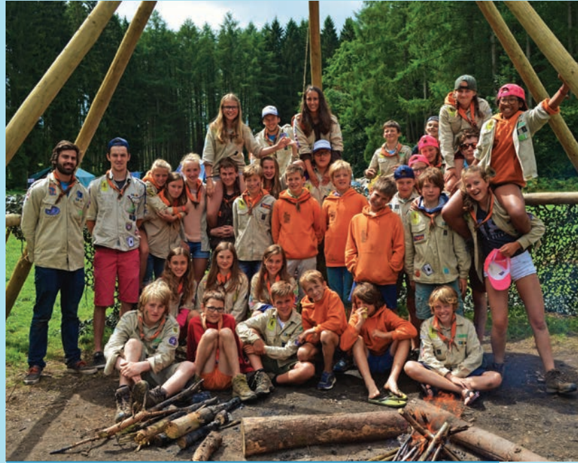
Echte scouts sjourren op kamp eigen tafels, kookvuren en zelfs toilet!

Tina: “Onze groep telt 126 leden waarvan 22 gemotiveerde leiders die elke zondag in weer en wind het beste van zichzelf geven.”