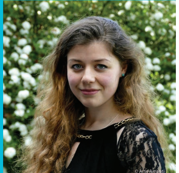
De Bulgaarse pianiste Victoria Vassilenko, een internationaal rijzende ster.

Dit extra Klassiek Op Zondag-concert vindt plaats op zondag 2 april om 11 u. in Abdijhoeve Ten Bogaerde. Tickets 12 euro, <26 j. 6 euro, via www.casinokoksijde.be of 058 53 29 99.