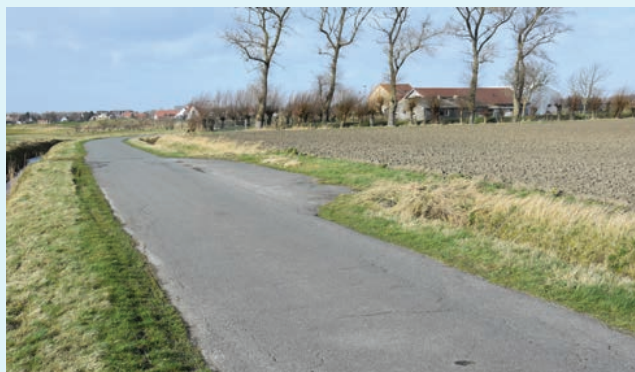
Van het dagcentrum De Bollaard (rechtsboven) tot het kanaal wordt de Hof ter Hillestraat hersteld.

Nieuwstraat - Het huidige tweerichtingsfietspad dient volledig vernieuwd om diverse redenen: de beperkte breedte (ca. 1,65 m) voldoet niet aan de fietsrichtlijnen, het is van de rijweg gescheiden door schrikkasseien , het asfalt is gebarsten en verzakt, bij huidige en vroegere bomen is het omhoog gedrukt. Daarom komt er van de Toekomstlaan tot het kanaal een nieuw tweerichtingsfietspad van 3 m breed in duurzaam rood cementbeton. De rijweg wordt versmald tot 4,40 m.