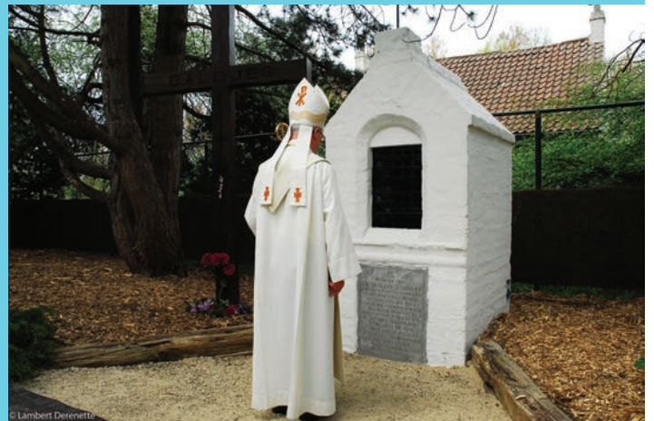
De kapel Baaldjes Kruus in de Jacques Van Buggenhoutlaan.