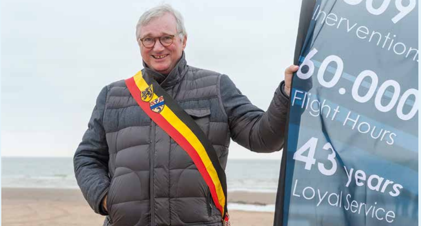
Koksijde nam op 21 maart afscheid van de Sea King.

Burgemeester: "Een jaarlijkse traditie in Koksijde. De Zeedijk van Sint-Idesbald wordt eigenlijk omgetoverd tot één grote tentoonstelling. Meer dan dertig strandcabines doen dienst als schilderwerken. De expo start op 11 mei en loopt nog tot 15 september. Zeker bekijken!"