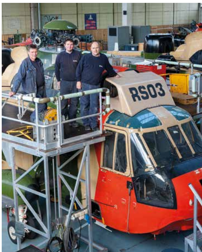
Technici van de gemeente knapten de RS03 op