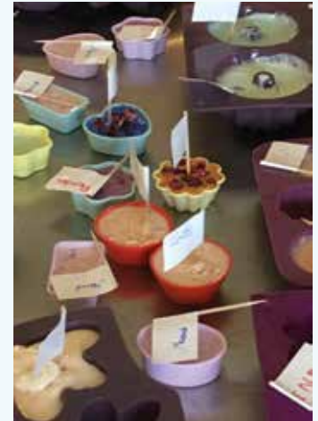
Geschenkje voor moederdag

Op zaterdag 11 mei van 10 tot 12 uur – doorlopend. Met natuurlijke ingrediënten maak je een huid- en milieuvriendelijk geschenkje voor Moederdag. Afspraak: Duinenhuis, Bettystraat 7, Koksijde. Info: duinenhuis@koksijde.be of 058 52 48 17.