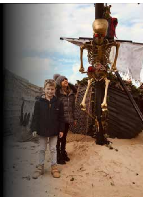
Vind jij de weg in het doolhof?