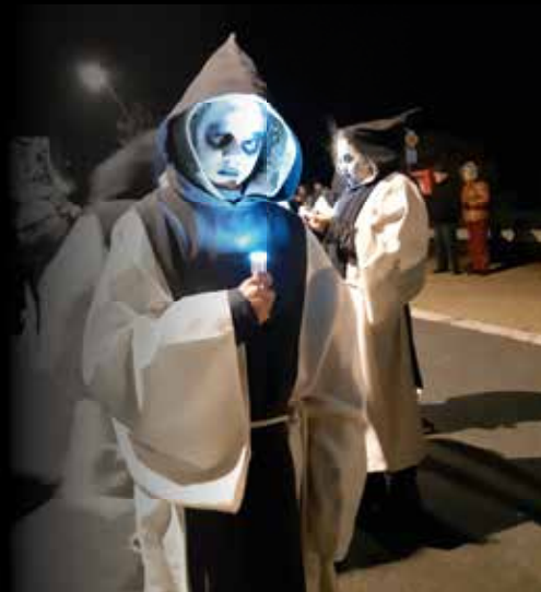
Sidder en beef tijdens de Halloweenstoet