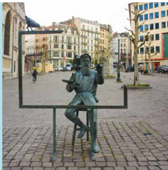
Monument voor Pieter Bruegel de oude in Brussel

Info: www.westhoekacademie.be – Veurnelaan 109, Koksijde