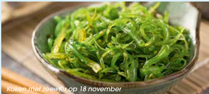
Koken met zeewier op 18 november