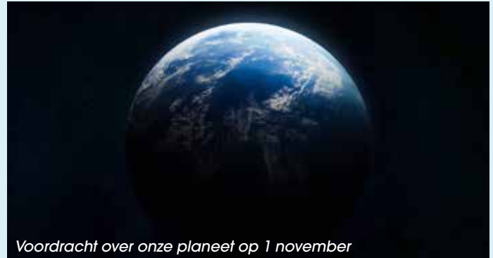
Voordracht over onze planeet op 1 november

Op vrijdag 1 november om 19.30 uur. Planeet Aarde, een planeet die tot leven kwam. Revolutie in de aardwetenschappen. Prijs: 4 euro (leden) of 5 euro (niet-leden). Schrijf je in via info@desternenjutters.be of www.desternenjutters.be . Organisatie: De Sterrenjutters i.s.m. Duinenhuis.