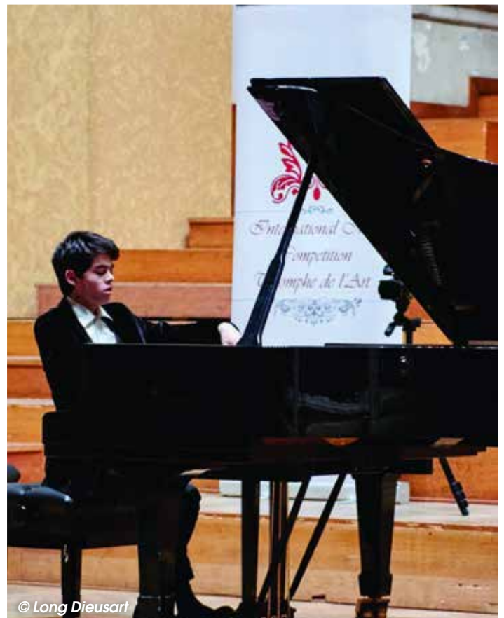
Long geeft al pianoles van toen hij 13 jaar was.

Info: jeugddienst@koksijde.be – www.depit.be