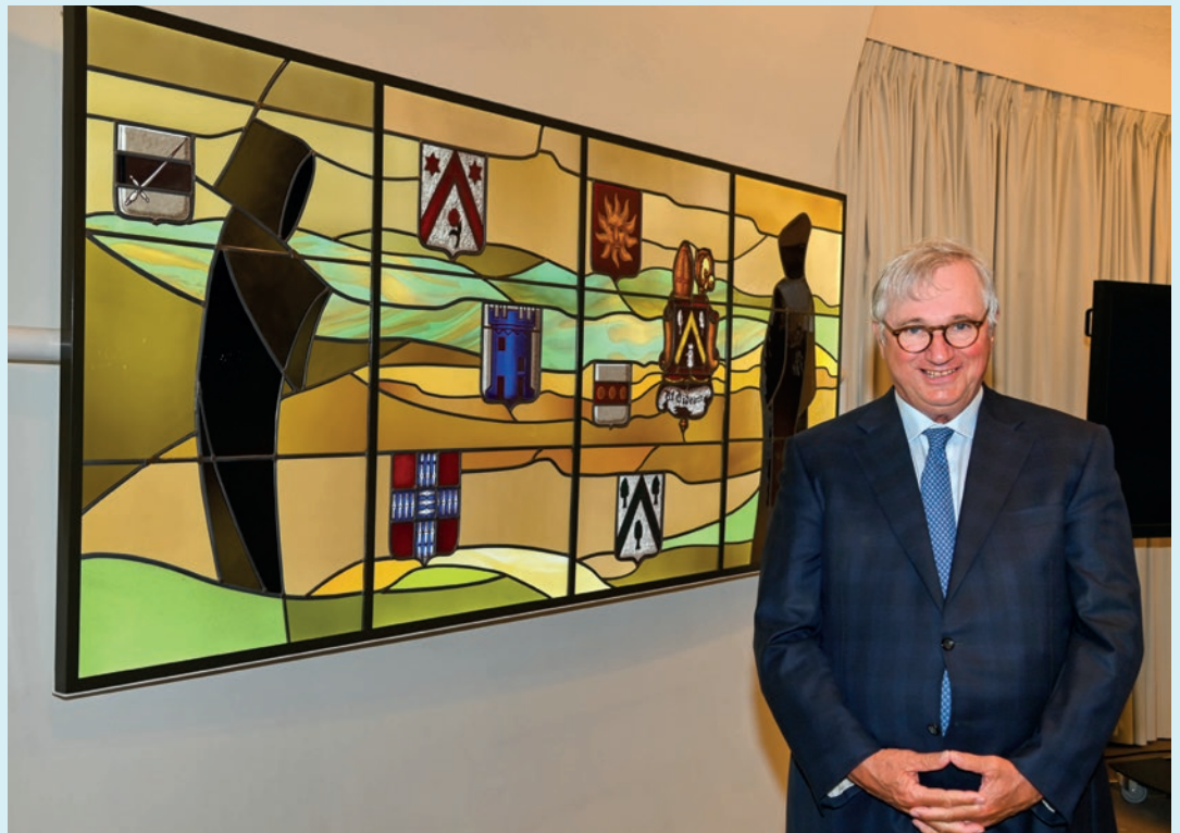
De burgemeester staat voor de glasramen van het oud-gemeentehuis

Burgemeester: "Alle handelszaken kregen de voorbije dagen telefoon met de vraag welke (logistieke) ondersteuning ze nodig hadden in functie van die heropening. Ook nu mogen alle ondernemers ons contacteren via economie@koksijde.be . We volgen de situatie geval per geval op en sturen bij waar nodig. Ook hier geef ik graag een pluim aan de mensen die dit mee mogelijk maakten."