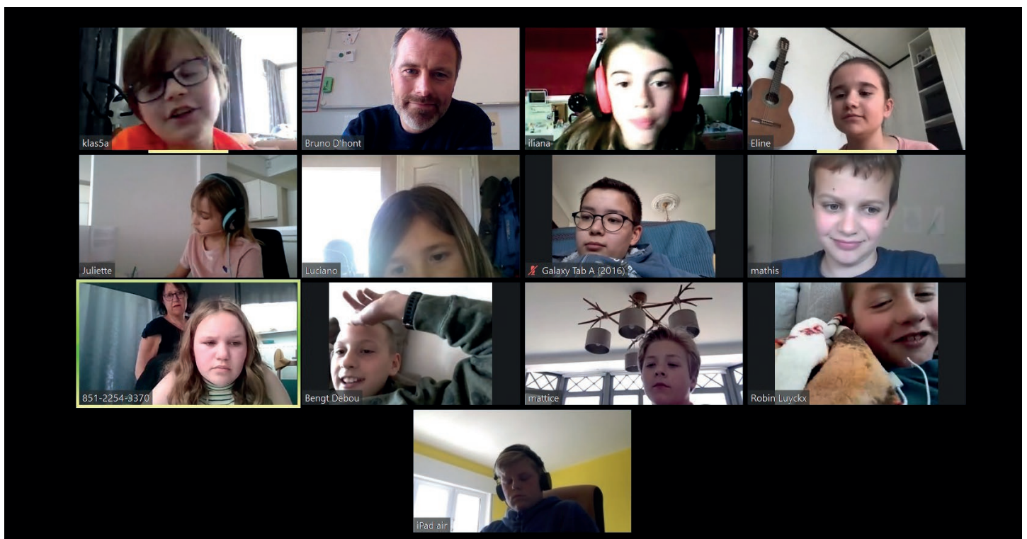
Klas 5A uit de gemeenteschool van Koksijde is aan het videobellen